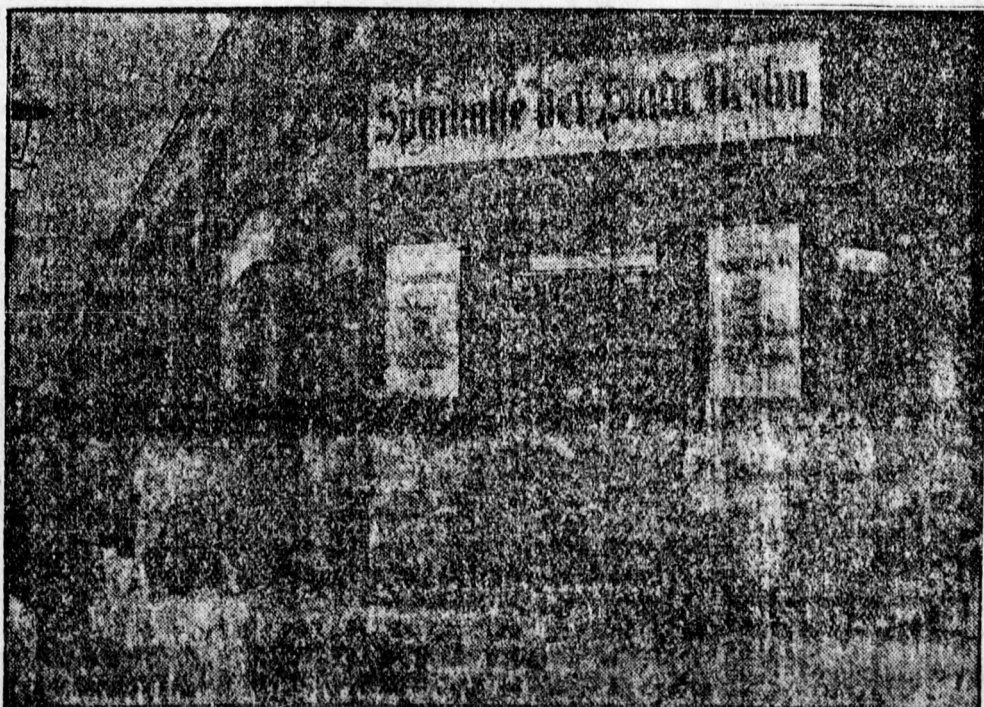
A németországi bankszünet napokból. Betevő tömeg rohama a Berliini Városi Takarékok előtt.

Ne a kihordóval tessék megüzenni a címváltozást.