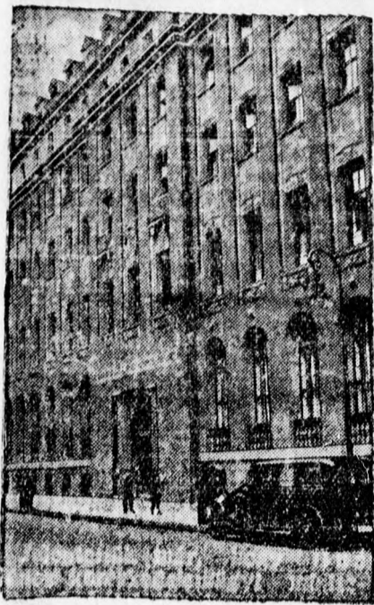
A Damathbank berlini központjának bejárata.