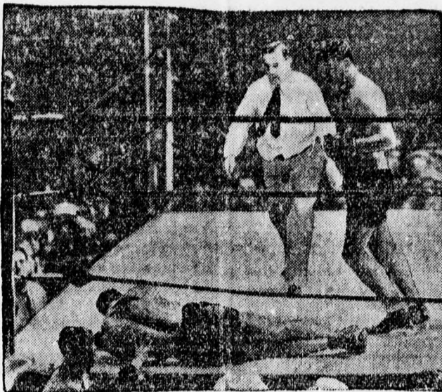
Kép a clevelandi boxmérkőzésről. Schmelling, a világbajnok knock-autolja ellenfelét, Striblinget.

Előadások kezdete hétköznap 1/9 órakor, vasárnap 1/2 és 1/9 órakor. Vasárnap a 1/2 óras előadás mérsékelt helyárrakkal.