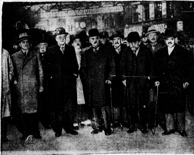
A miniszteri delegátusok Londonban a Viktória pályaudvaron. — Balról jobbra: dr. Curtius német külügyminiszter, dr. Brüning német kancellár, MacDonald angol miniszterelnök, Briand francia külügyminiszter, Laval francia miniszterelnök.

tőlük telhetően hajlandók a bizalom helyreállítására céljából együttműködni.