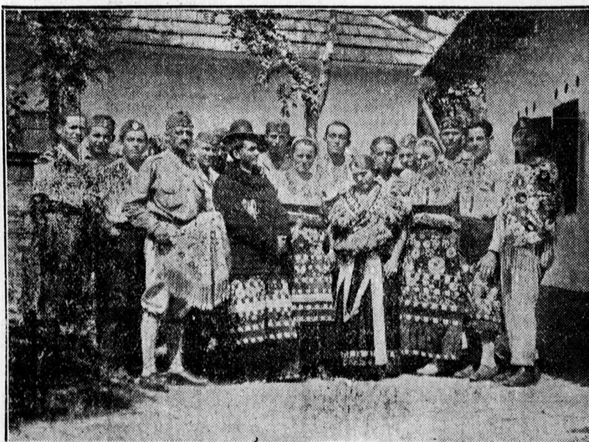
A debreceni iparosleventék Mezőkövesden. Középen mennyasszony, völgyény esküvői díszben.

megtekinteni. A község előjáróságánál a parancsnok tisztelő látogatást tett. 12 órakor ámentünk a Rákóczi vendéglőbe, ahol 1.10 P-ért izletes ebédet kaptunk, majd fényképfelvételt csináltunk mezőkövesdi benszülőttek társaságában. 2 óra 30 perckor a kürtszóra kivonuló csapatot uccahosszat sokan üdvözölték, míg a sok kis kerék által felvert por eltakarta a szemek elől. Késő délután 18 órakor már megérkezett a kerékpáros csapat a tiszafüredi szálláshelyre.