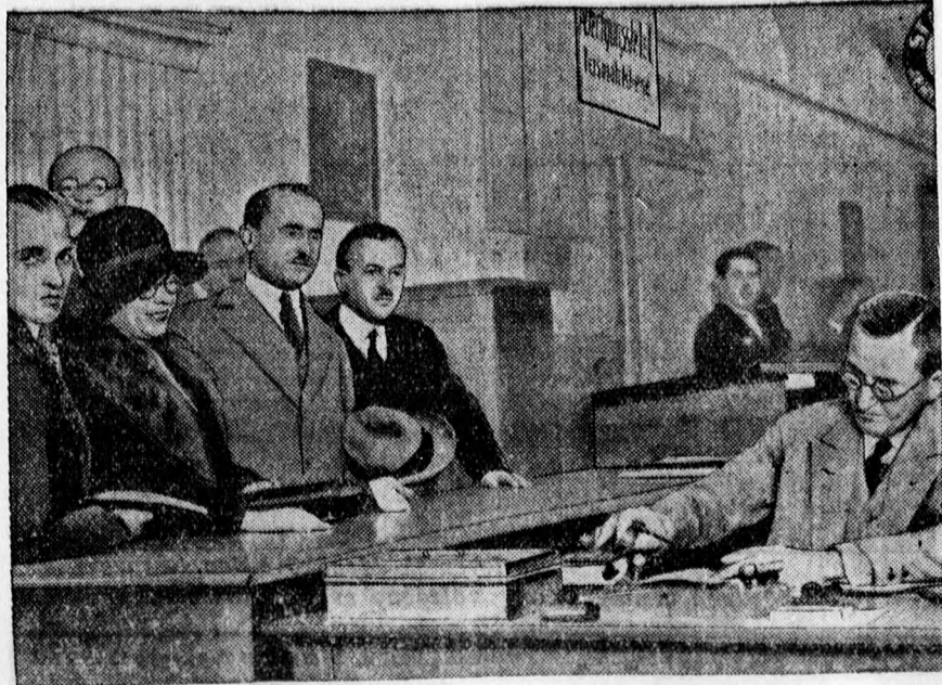
A berlini rendőrfőnökség utlevélosztályának pénztára, ahol most minden utlevél után külföldre utazás előtt 100 márkát kell fizetni.