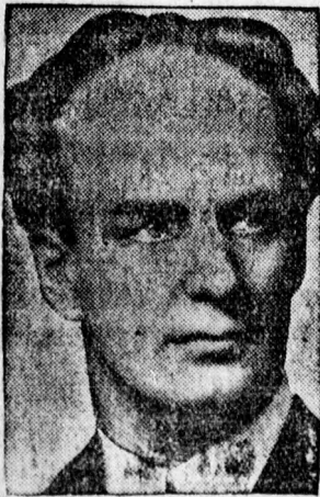
Furtwängler Vilmos, a világhírű eldirigens a bayrouthi ünnepi játékok főzeneigazgatója.

Bécs. 11.30: Zenekar. 1.15: Gramofon. 3.50: Gramofon-jazz. 5: Zenekar. 5.50: A II. munkásolimpiász motorkerékpárversenyének helyszíni közvetítése. 6: Zenekar. 8: Opera Salzburgból. 10.50—0.30-ig: Táncczene. Prága. 7.05: Vidám est. 8.35: Színmű. 9: Fuvózenekar. 10.40: Rádiófilm. Varsó. 8.15: Könnyű zene. 10.30: Hangverseny.