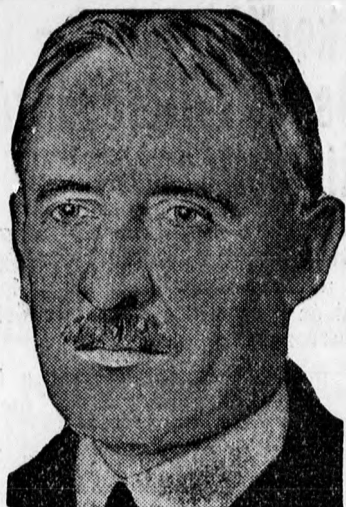
Stimson, Amerika külügyi államtitkára, az Egyesült Államok egyik képviselője a londoni konferencián.

indenesetre k, hogy a ikereken zel kilátás ntul majd élkül utaz- m ez a ké- ttt a gumi- letezéshez, hogy a ke- ák. Az ed- a surlódás mozdony l olykor a jelenség ozdonyok- erekei nem sinekhez. azonban a kozódható, donyok is ni. Így a eddiginél alkalmaz- gyobb sur- tat a na- szon. Ezek a kísérle- országban eansi vasut tek. Ez az emelkedé- ni a moz- A kísérlet gítők vol- kariák ve- ál a gumi- gyasztás