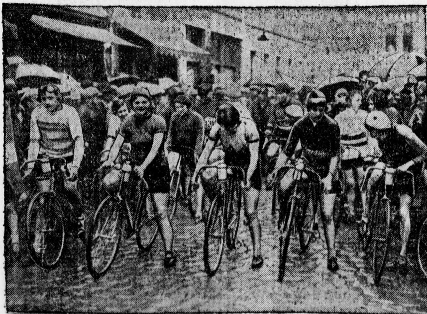
Női kerékpárosok indulása az Európa-bajnokságban.

Kedvező fizetési feltételek. Értekezni Piac ucca 70., ügyvédi irodában.