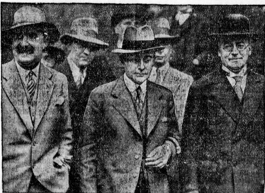
A londoni konferencia után a német sajtóattasé, dr. Curtius külügyminiszter és dr. Brüning kanclár tétőkoztatják a sajtó képviselőit.

Közlöm a város érdekelt lakosságával, hogy az 1884: XVII. tc. 54. szakasza alapján elrendeltem, hogy a kenyér árát fogyasztók számára történő eladási helyeken kötelesek az elárusítók súly szerint és a kenyér előállítására felhasznált liszt minőségének megjelölése mellett a közönség által látható helyen szembevetendő módon,