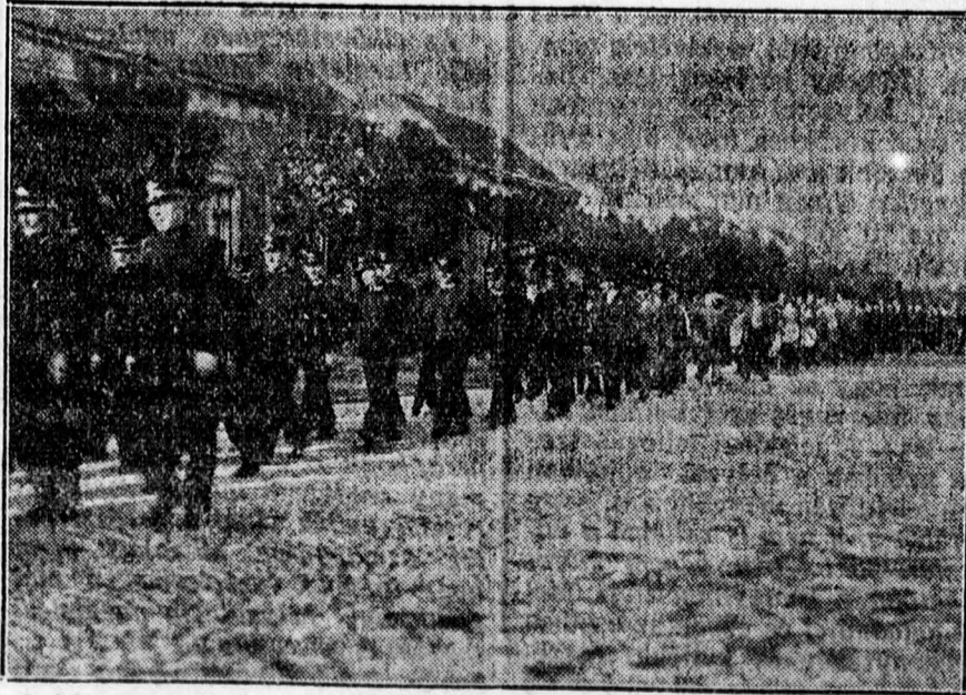
A debreceni csata évfordulóját ünneplő közönség hatalmas menetének egy része a Hősök temetőjébe vonulás közben.