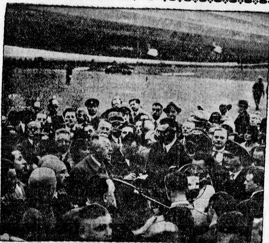
A Graf Zeppelin visszaérkezése az északsarki utazásról. Dr. Sahn berlini főpolgármester üdvözlő dr. Eckenert. Háttérben az óriási léghajó.

Az orvosnak szinte erőszakkal kellett a fájdalomtól elalétt nő