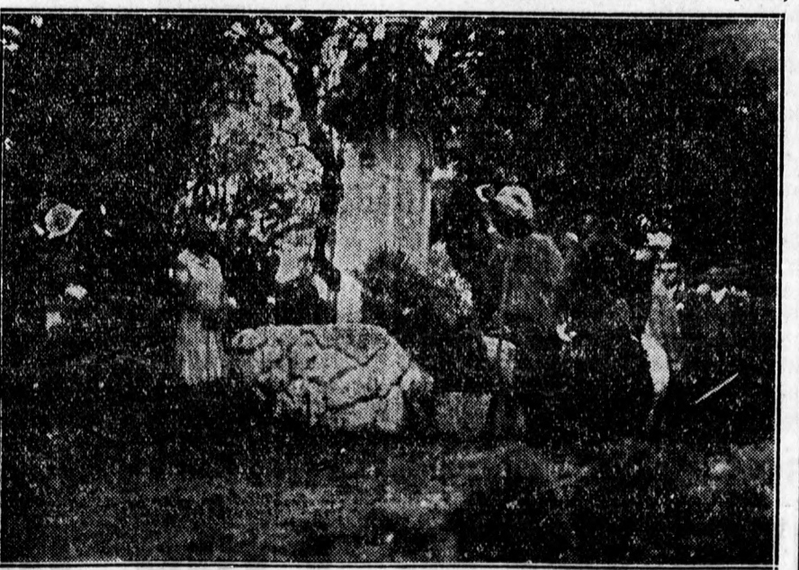
A honvédsiremlék megkoszorúzása a debreceni csata emlékközpén.

dult el a városháza udvaráról a MÁV Egyetértés zenekarával. A több ezer főnyi hatalmas menetben ott haladtak a frontarcosok, leventék, hadiárva és számos testület és intézmény küldöttségei, valamint a nagyközönség tömött sorai. A honvédtemetőben, ahol a Hősök mauzoleumát építik,