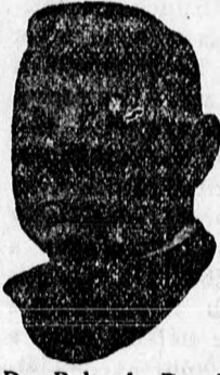
Dr. Baltazár Dezső.

amely csupán szerény jutalma azoknak a nagy érdemeknek, melyeket dr. Baltazár Dezső püspök hivatalbalépése óta szerzett a magyar református s így a magyar nemzeti értékek megmentése terén. Működése nyomán a magyar nemzeti szellemnek életet adó intézmények menekültek meg azoktól a csapásoktól, amelyek különben pusztulásra ítélték volna a forradalmak óta letelt idő alatt azokat. Erkölcsei, világnézeti válságok, politikai és közgazdasági összeomlások idején szilárd kézzel irányította dr. Baltazár Dezső püspök a magyar református egyház hajóját s ebben a működésében a szent célok elérése érdekében hihetetlen akarat-erővel és hosszútűréssel tartott ki a rábizott eszmények ápolásában. — Közéleti munkássága terén kemény s akarat-erővel teli férfi, a magánéletben könyörületes, jóságos szívű ember: igazi mintaképe a keresztényen lelkesnek s működésének, példaadásának nyoma századokig érezhető lesz a református egyház-