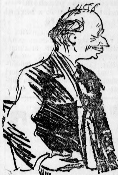
Scialoja, Olaszország képviselője a hágai döntőbíróági tárgyaláson, éles beszédet mondott, kijelentve, hogy Olaszország a vámunió ügyét nem jogi, hanem politikai problémának tekinti.

KERTI BUTOROK, vaságvak, sodronyágybetét legjobban minőségben kaphatók KERTI SATOR NEUMANNAL, Péterfia 19.