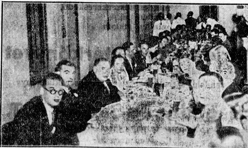
Az Országos Kamaraszínház háromszedik jubiláris előadása alkalmából rendezett társasvacsoara résztvevői az Ujságíró Club terraszán.

javasolja dr. Friedmann, vagyis a kliringforgalmat, azt, hogy