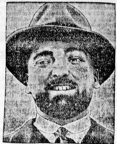
Grandi, az olasz külügyminiszter.

tornyosuló akadályait, amelyek az egész világot fenyegetik. Erre a célra törekedtek Chequersben, Párisban, Londonban és Berlinben és