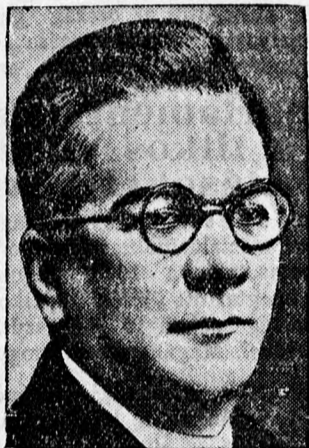
Machado Morales, Kuba elnöke. Kuba köztársaság több tartományában felke- lés tü. ki a kormány ellen.

rozottan kijelentette, hogy a 10 éves kormányzás fáradalmi és a legutóbbi események annyira ki- merítették, hogy továbbra nem ki- ván résztvenni a politikai élet irá- nyításában.