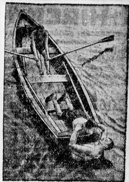
A német rendőrség vizből való életmentési gyakorlata.

egyesület vezetősége elhatározta, hogy ezt az akciót ki fogja szélesíteni. Csakhogy egy baj van. Ma, az autó korszakában, amikor a lovak és a tehénk száma lecsökkent, lecsökkent a trágyahozam is. Már pedig primőrök csak meleg helyen lehet termesztetni. Viszont a szénrel és fával fűthető üvegházak felállítását a szegény kertészpar nem bírja el. Ezért felvetődött az az ötlet, hogy Hajduszoboszló környékén kellene egy ilyen kertészkolóniát létesíteni. Hajduszoboszlón, mint ismeretes, egy 15 fokos hőforrás van, amelynek vizéből a kihasználás dacára naponta 18—20.000 liter meleg veszendőbe. Ennyi folyik el. Ezt a vizet akarják a kertészek aképpen értékesíteni, hogy felhasználják az ott létesítendő üvegházak fűtésére.