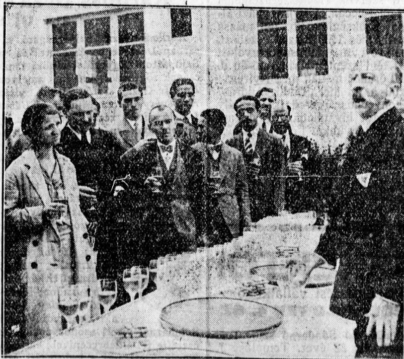
Az amerikai nemzetközi kongresszusra ment debreceni KIE-csoportot Párisban ünnepélyesen fogadták.