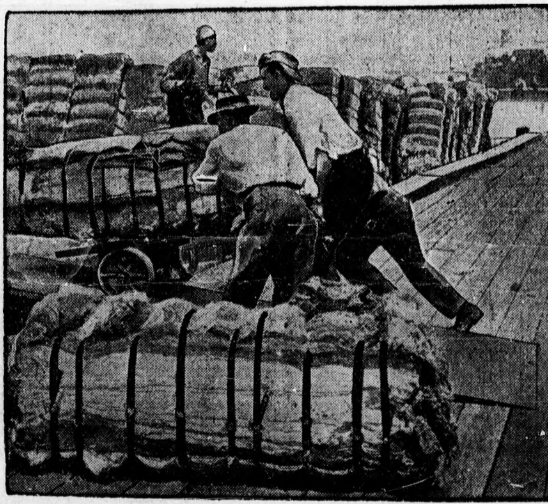
Amerikában a rekordtermés következtében katasztrófális áresés van a gyapjubörzén. Floridában óriási mennyiségű gyapjubálát hajóznak ki.

Az Egyesült Államok földművelésügyi minisztériumának mintegy kétezer alkalmazottja van, akik mezőgazdasági és közgazdasági kutatószobák irányítanak. Ezek az alkalmazottak vizsgálják a gyapjút, a buzát, valamint az összes mezőgazdasági terményeket, a vetéstől az elszállításig, minőség szerint osztályozzák őket, vizsgálják a zöltséget egészen a piacra kerülésig, a cukrot, tejet, tojást és minőségi bizo-