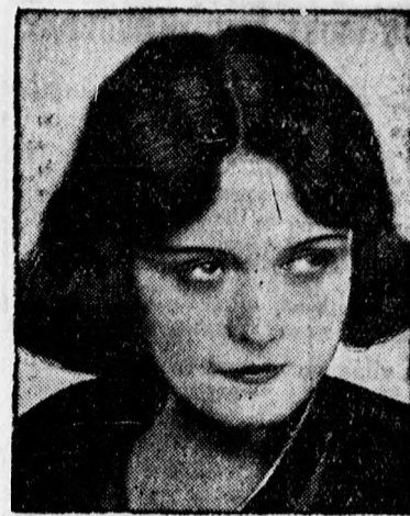
Pola Negri, a világhírű filmszínésznőt megvakulás veszélye fenyegeti és ezért Amerikában meg kell operálni.

nyitványokat adnak ki. Az irodák állandóan összeköttetésben vannak az Egyesült Államok földművelésügyi minisztériumával, ettől rendszeresen megkapják az ottani termelésre vonatkozó adatokat, szükség esetén kábelgram utján. A mi főirodánk Belgrádból küldi az információkat földművelésügyi minisztériumunknak, valamint a fontosabb közgazdasági tényezőknél, nagyobb behozatali és kiviteli irodáknak és a nemzeti bankoknak, viszont minisztériumunk ezzel szemben ide küldi meg nekünk a közgazdasági helyzetre vonatkozó összes kiadványokat. Mi csak hivatalos tényezőkkel vagyunk kapcsolatban, vagy pedig azokkal, akiknek valamilyen hivatalos megbízásuk van, mint például Magyarországon a Futura, vagy a dohánymonopólium.