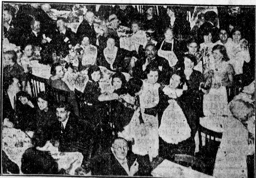
A Mester uccai egyházrész által az ORLE-kongresszus tagjai tiszteletére rendezett vacsora résztvevőinek egy csoportja.

Ebéd után huszas csoportokban a kollégiumi Nagykönyvtár, református főgimnázium, Déri-muzeum, Kistemplom,