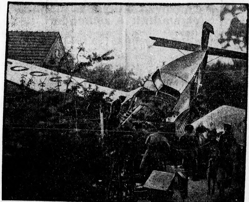
A Berlin—London közt közlekedő repülőgép motorhiba következtében szükségesszállást végzett Berlin egyik elővárosában, Lankwitzban. — A repülőgép egy kertben szállt le, összerombolt egy lugast és súlyosan megsebesítette a ház asszonyát. A repülőgép legénysége sértetlen maradt.

2. §. 1. A 4560—1931. ME. sz. rendelet 5. §-ának 1. bekezdését azokra a bejegyzésekre is alkalmazni kell, amelyeket a 4560—1931. ME. sz. rendelet életbeléptetése és a jelen rendelet életbeléptetése közötti időben rendeltek