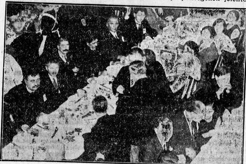
A debreceni református napokra érkezett lelkészek vacsorája a Dóczy-intézetben

Továbbmeően kéri a kongresszus a kormánytól, hogy amíg ez a fizetésrendezés elkövetkezik, a törvényes korpótlék teljes összegű folyósításával és gyermekeik részére nevelési segéllyel segítsen a lelkészek helyzetén. A konventtől azt kéri, hogy a hátralekös párbéreket az egyházzal fizetessék ki, hogy azok aztán az egyház részére behajthatók legyenek. A kormánytól kéri, hogy a terményfizetés kárpótlást 1930—