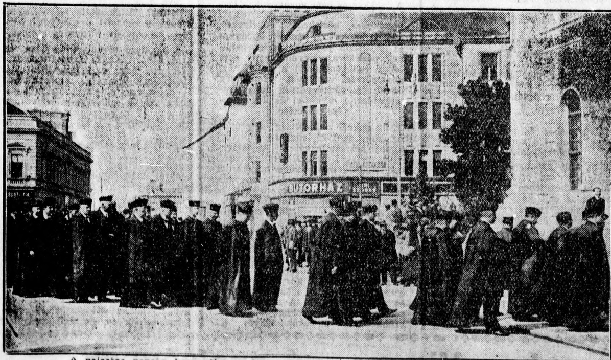
A palatos papság bevonulása a Nagytemplomba az egyházkerületi közgyűlésre.