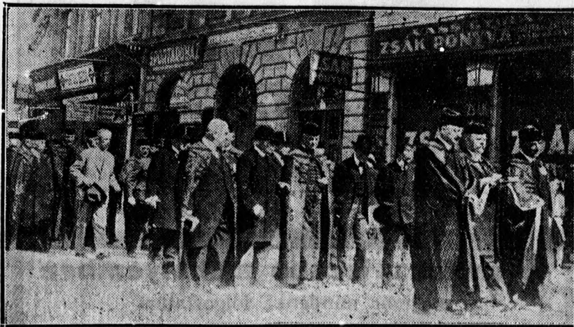
A Zwingli-emléktábla leleplezése után a menet megindul az Országos Presbiteri Szövetség gyűlésére.

Örömmel és áldás kívánással köszöntöm a megcsontított ország minden részéből egybegyűlt presbitereket; miköz-