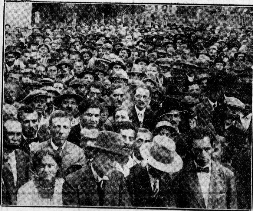
A vasárnapi szocialista népgyűlés közönsége.

lós országgyűlési képviselőket, mintegy 4000 főnyi közönség hallgatta meg. Nagy feltűnést keltettek Hajdumegye vidéki városából és községekéből érkező csizmás küldöttségek, amelyeknek tagjai