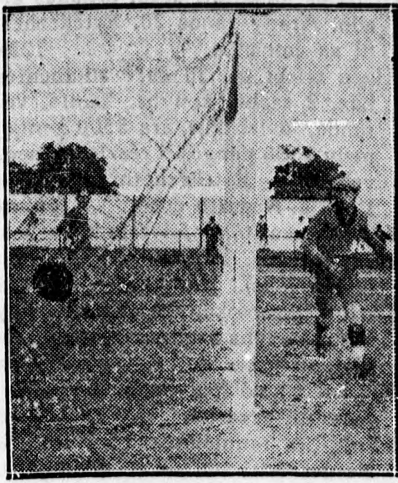
A Bocskay első gólja az ungvári csapat hálójában.

Vasárnapi futball eredmények. Vasas—Sabaria 3:1 (3:0), bajnoki. Ferencváros—Concordia (Zágráb) 2:2 (1:2). Hungária—Jugoszlávia 6:3 (3:3), Universita—piUest 5:4 (3:3).