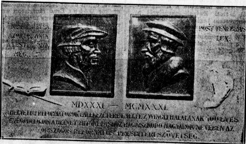
A Zwingli-Kálvin emlék tábla a Kollégium falán.

Az ötödik s legfontosabb deklaráció a következőképpen hangzott: