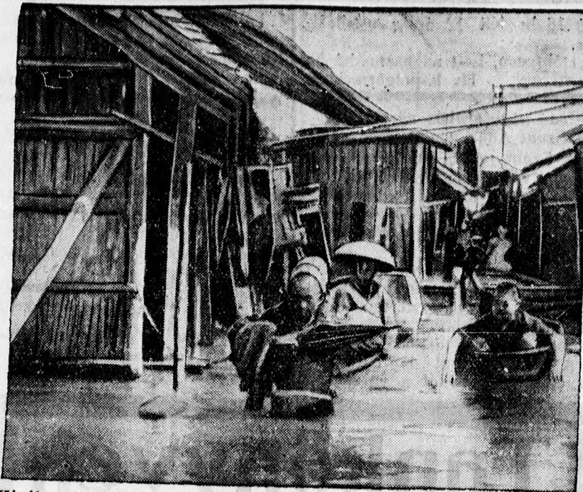
Kínában 16 millió ember vált hajléktalanná az árvíz miatt. Yuen-Kiang városka lakóinak kétségbeesett menekülése az áradás elől.