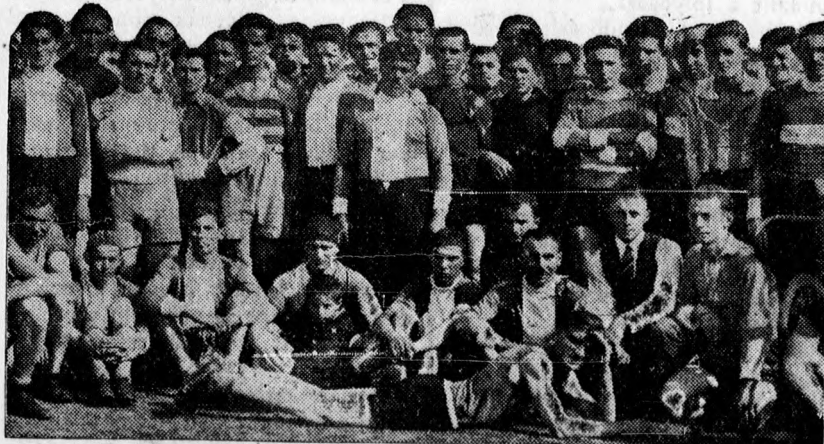
Az alföldi kerület kerékpár-pályabajnokságainak résztvevői.

Hevesnek ígérkezik az Ügető téren lejátszásra kerülő DKASE—DMTE mérkőzés. A kereskedők kissé erőtlen csatárjátéka könnyen megbosszulhatja magát a munkások masszív védelme ellen. Egyébként is a DMTE az utóbbi két évben sokat javult, állandó együttessel szerepelnek, míg ellenfele kénytelen új erővel kísérletezni. A debreceni egyesületek kartelbe léptek s közös kaszárára rendezik a mérkőzéseket. A megegyezésből hiányzik egyelőre a DVSC hozzájárulása, de remélhető, hogy ez nem fog utjába állni a célszerűségnek, amely egyedül lehet utja az amatőrök boldogulásának.