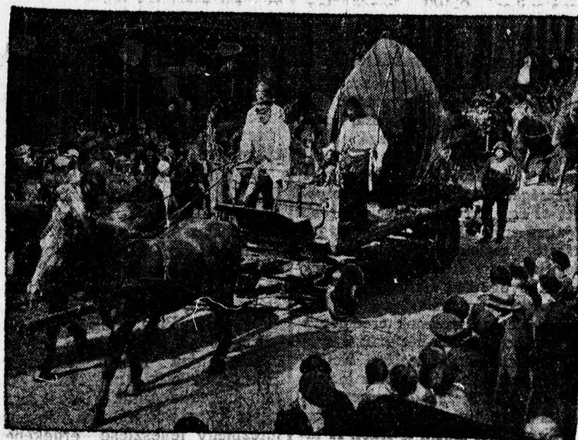
A hagyományos stralau halászménet. — Berlin kedvelt népünnepélye.

miniszterelnök az ellenzék kívánságát honorálta és kimondták a nyilvánosságot, de ennek ellenére is csak igen szűkszavú közleményben tájékoztatták a közönséget. Az ellenzék tagjait ez igen kellemtelenül érintette, mert az ellenzék éppen azért vesz részt a bizottságban, hogy a parlament szü-