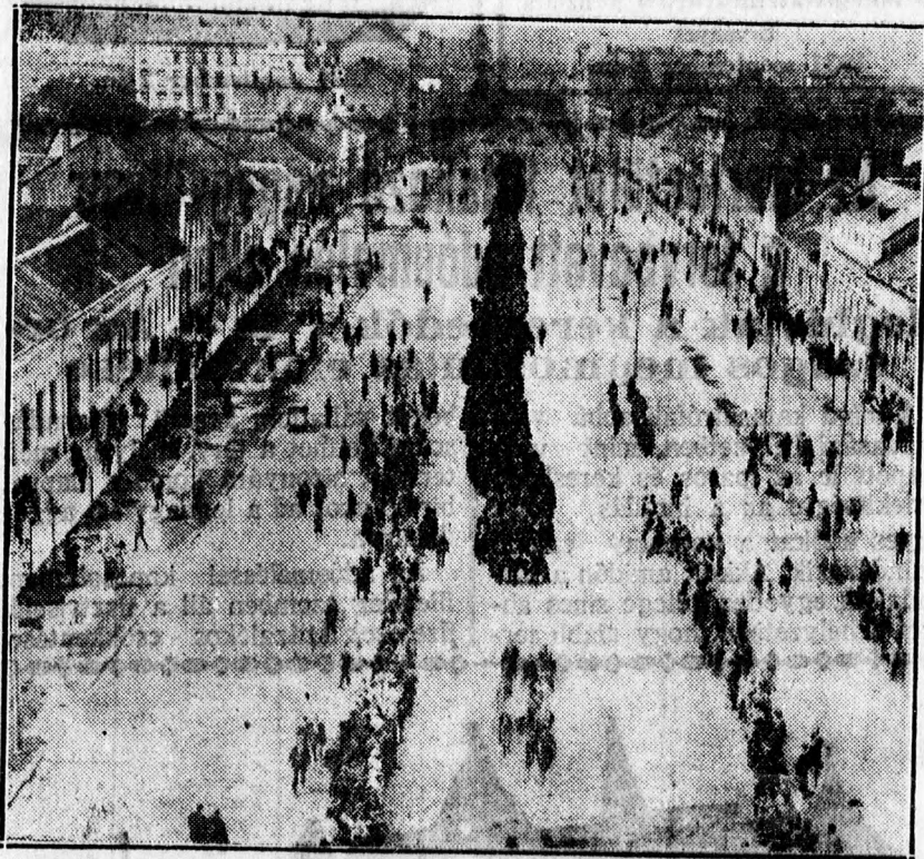
Az Országos Református Presbitéri Szövetség tagjainak felvonulása a Kossuth uccai templomba.

Tárgyalták a gazdasági bizottság javaslatát, mely arra vonatkozott, hogy a polgári iskolai tandíjakat a jövőben az egyházi pénztár kezelje. Eddig a tandíjakat az igazgatók kezelték és ezért négy százalék kezelési költséget kaptak, ami helyenként felment 3200 pengőre is.