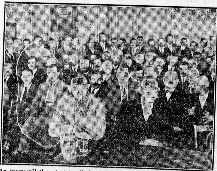
Az ipartestületben tartott tiltakozó nagygyűlés résztvevőinek egy csoportja.