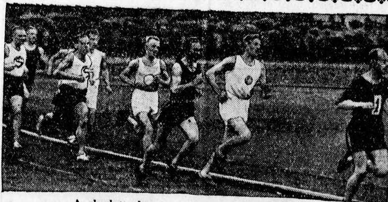
A charlottenburgi verseny. Az élen fut Nurmi.