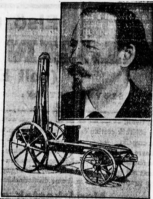
Most száz éve született a benzinautó feltalálójá: Siegfried Márkus, aki 1865-ben építette meg az első benzin által hajtott autót, amely őse lett a mai autónak. — Fenn a feltaláló Lenn az első benzinautó.