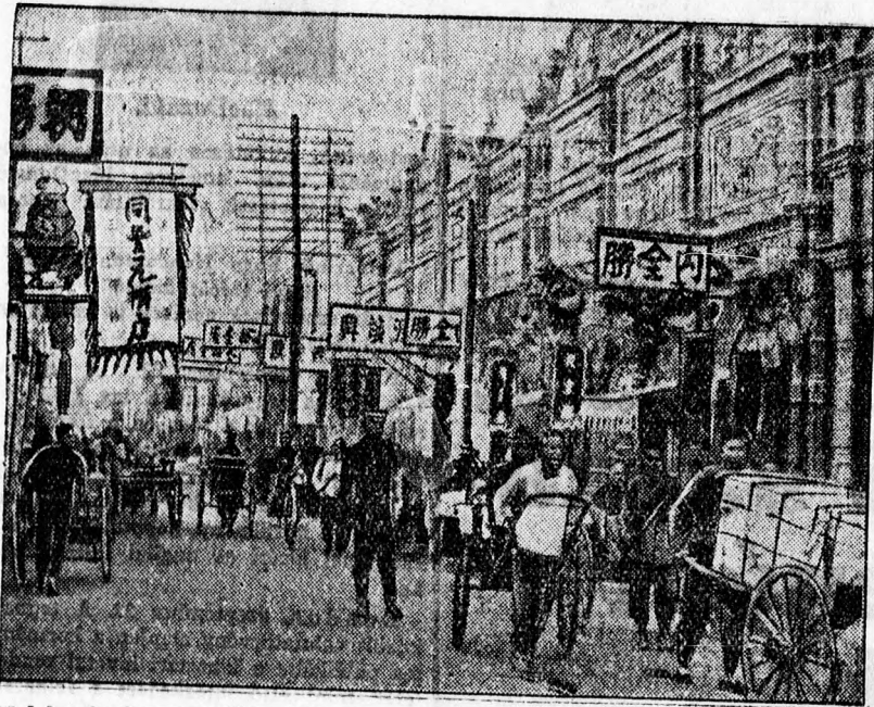
Mukden japán megszállás alatt. Az uccán már japán rendőrök vigyáznak a rendre.

Pekingi táviratok megerősítik, hogy a japán haderők folytatják Mandzsuria megszállását. Mukden és Csungcsang után birtokukba vették Irin városát is és Taomaning nyomultak elő. Számos mandzsui város japán repülők bombáztak és a japán parancsnokság kiáltványban közölte a lakossággal, hogy a birtokába vette az országot. Pekingben az egyetemi hallgatók népes gyűlésen tiltakoztak a japánok jogellenes betörése ellen és a Japánnal való gazdasági kapcsolat megszüntetését követelték.