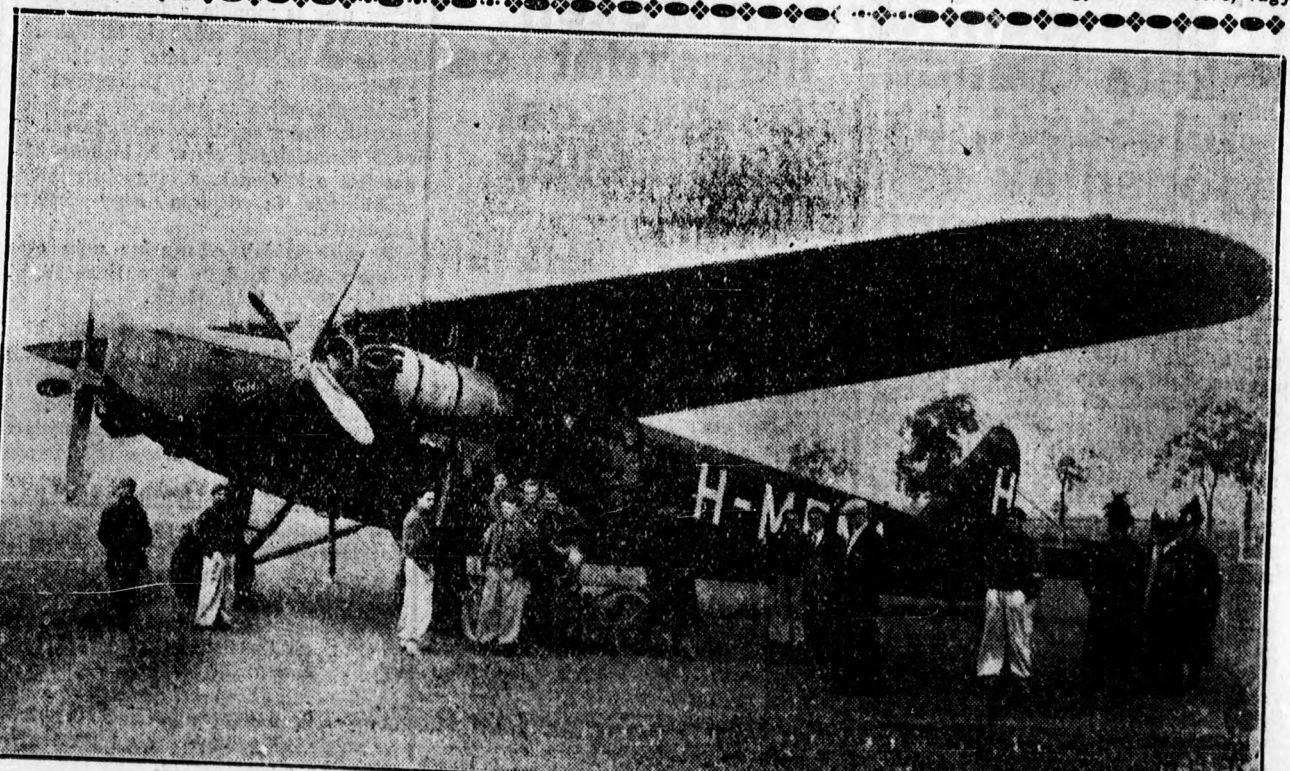
A vasárnapi debreceni repülőnapról. Az utasszállító kétmotoros Fokker gép.

A konzervatív pártnak az a része, amelynek hangulatát a Daily Express szokta kifejezni, sürgeti a „tarifaválasztásokat”, mégpedig MacDonalddal a konzervatív párt élén. Ez a kombináció persze csak szimptomatikus jelentőségű.