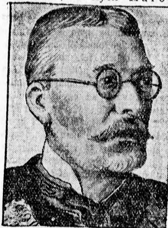
Károlyi Gyula gróf

Budapest, szeptember 24. Az egységspárt csütörtök este értekezést tartott, amelyen Károlyi