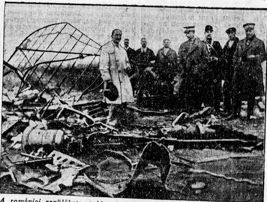
A romániai repülőkatasztrófa. Bukarest közelében a páris—bukaresti vonal egyik utasrepülőgépe lezuhant és teljesen ronccsá lett. — A két pilóta és négy utas meghalt. Képünk a roncsokat mutatja.