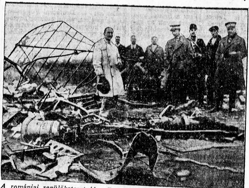
A romániai repülőkatasztrófa. Bukarest közelében a páris—bukaresti vonal egyik utasrepülőgépe lezuhant és teljesen ronccsá lett. — A két pilóta és négy utas meghalt. Képünk a roncsokat mutatja.

Dr. Vásáry István polgármester helyt adott az előterjesztésnek és az óvodák zárvatartását október 15-ig elrendelte. Az elemi iskolák október 1-én való megnyitásának akadályja nincs.