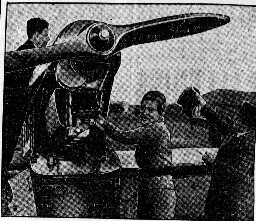
Elli Beinhorn, a világhírű női pilóta keletázsiai utra készül.

Valamennyi lakás központi fűtéssel. A házban személyfelvonó van, amely a lakók által ingyenesen igénybe vehető. Érdeklődni Piac ucca 34. könyvkereskedésben.