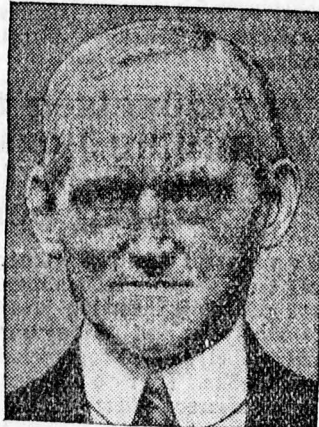
Philip Snowden, Anglia kinestári lordja, a kinek kezében fekszik most az angol pénzügyek sorsa.

mutatkozott tegnap is. Az arany 103 shilling és 5 pennys jegyzésével rekordjegyzést ért el. Az arany a válság kitörése napján még 88/9 volt.