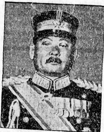
Minami tábornok, a mandzuriai japán hadserg vezetője.

London, szeptember 25. Tokióból je- lentik: A japán kormány hosszú nyilat- kozatban ismerteti a mandzuriai hadmű- veleteket. Hangsúlyozza, hogy Japán