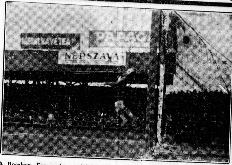
A Bocskay-Ferencváros mérközésről. A harmadik gól a Bocskay kapujában.