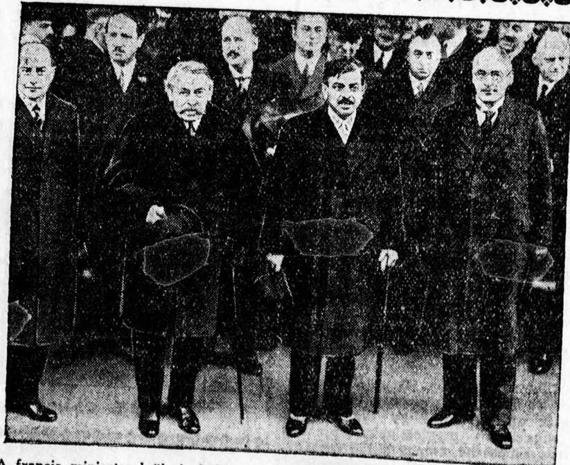
A francia miniszterelnök és külügyminiszter látogatása Berlinben. — Balról jobbra: Dr. Curtius német, Briand francia külügyminiszter, Laval francia miniszterelnök, Brüning német kancellár.

kályhás mesternél CSAPO UCCA 19. TELEFON 568. SZ. Cserépkályhák átrakását, tisztítását jutányosan vállalom