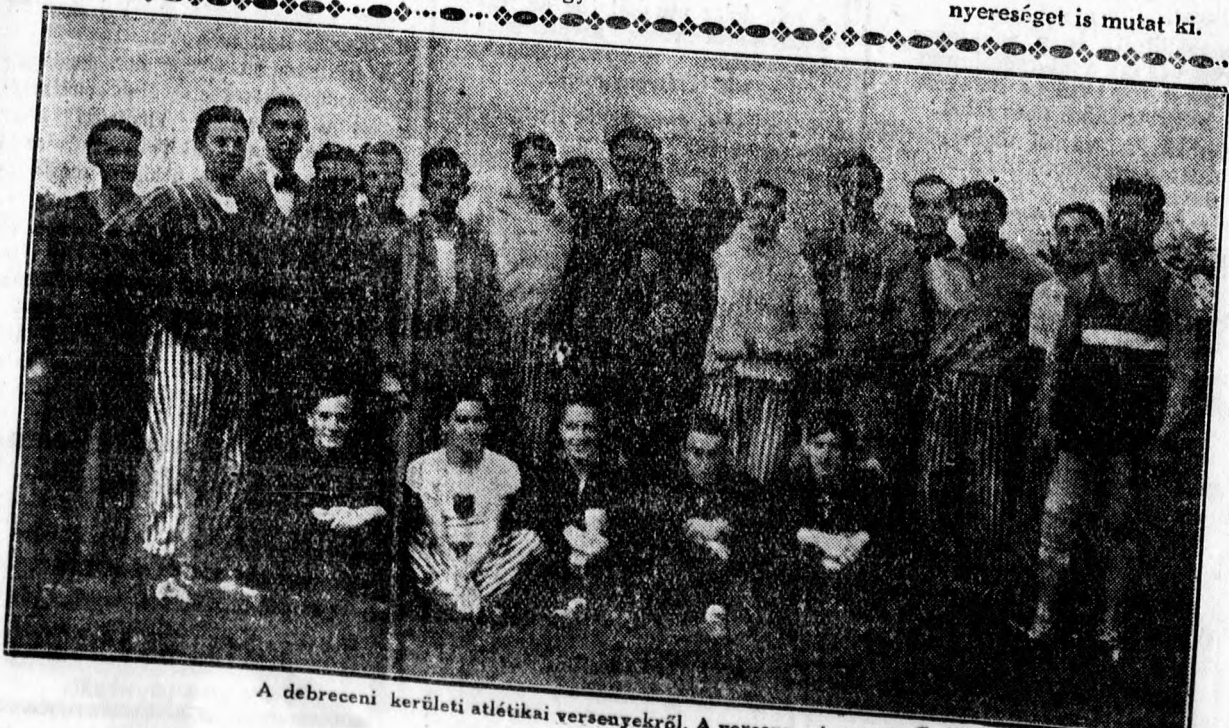
A debreceni kerületi atlétikai versenyekről. A verseny résztvevői.

Ezután a bizottság ismét személyzeti kérdésekkel foglalkozik és java-