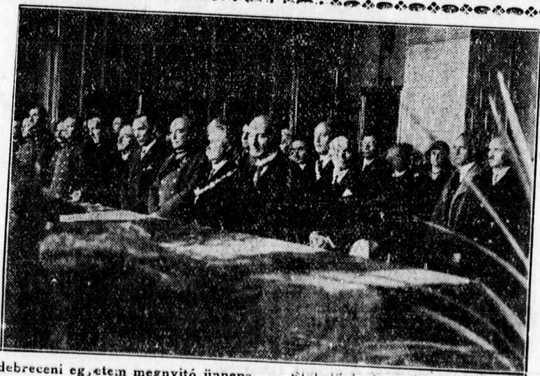
A debreceni egyetem megnyitó ünnepe. — Előkelőségek a közönség soraiban.

A városi téglagyár tehát itt is és is- mételtén a sok többi példa mellett igazolja, hogy el kell törölni a debre-