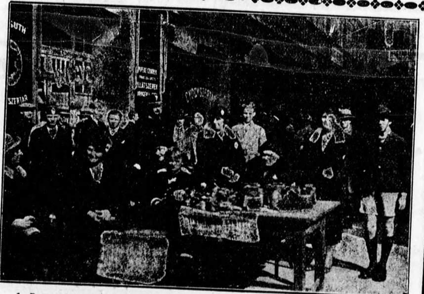
A Patronázs gyűlőnapja. Gyűjtő urnák a Dobozy passzázsnál.

leszállította az aktív és nyugdíjas közalkalmazottak illetményét, emelte a forgalmi adót, a cukoradót, a házzükségadót,