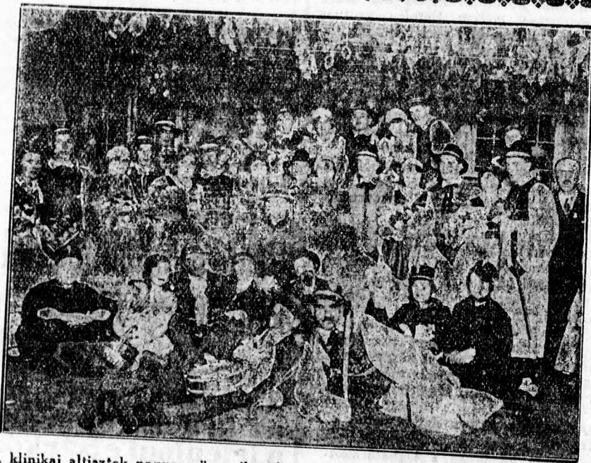
A klinikai altisztek nagyszerűen sikerült szüreti mulatságot rendeztek a nagyerdei Vigadóban. Képünk a szereplők csoportját mutatja.