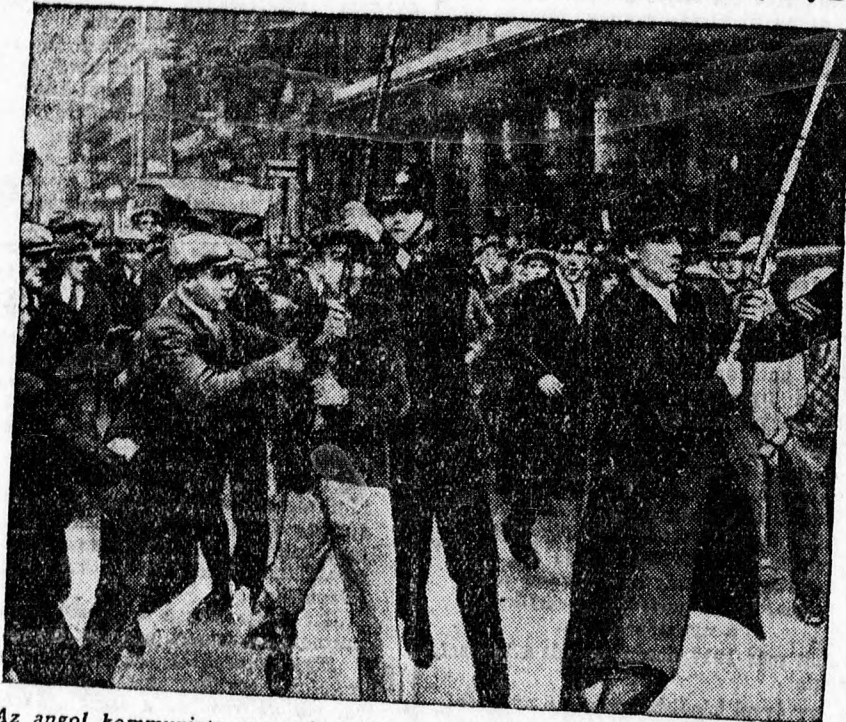
Az angol kommunista zavargásokból. A londoni rendőrség kiszakítja a tüntetők kezéből a vörös zászlót.

kocsi sebességét, hogy a karambolok elkerülhetők legyenek. Bizonyították, hogy Polgár a vele szembejövő kerékpárost meglátva rövid szögben vette a kanyart és jobb oldalra tért ki. Az ítéletet dr. Kádár István ügyész tudomásul vette, az elítélt felebbezést jelentett be.