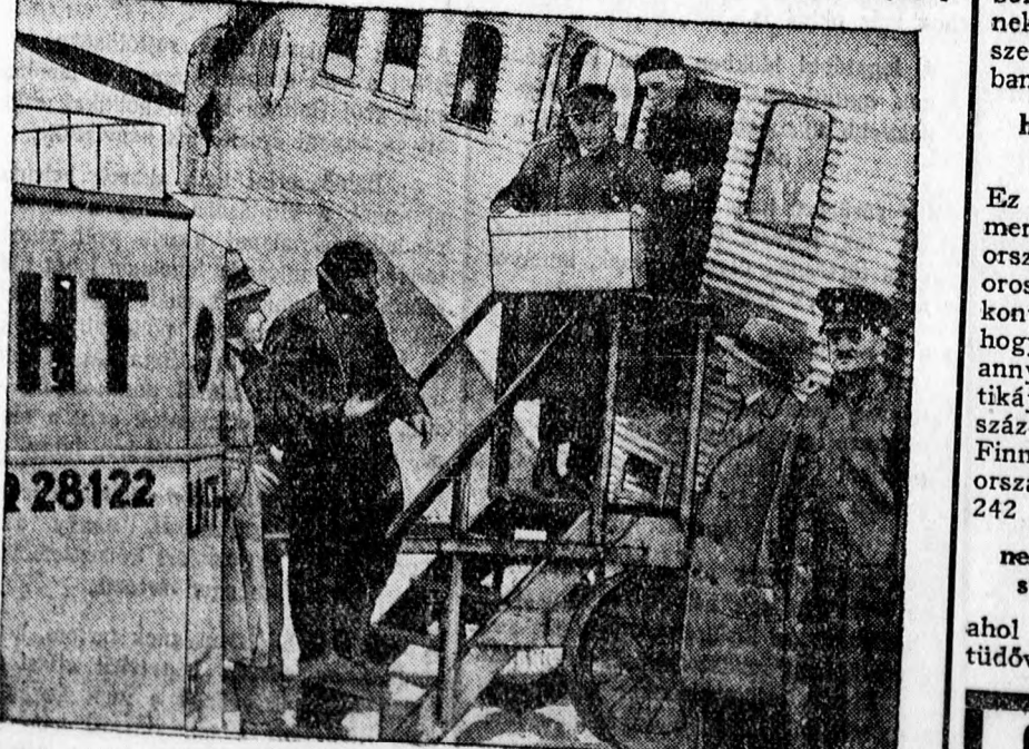
A Bécsben visszamaradt fecskéket, amelyek a hideg és vihar miatt nem tudtak délre szállani, repülő gépen Olaszországba viszik.

Szegényházban ápolatott 193 egyén, eltávozott 1, meghalt 3, ápolás alatt maradt 189, beteg volt 42.