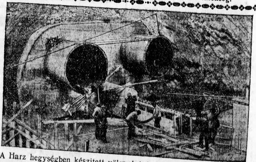
A Harz hegységben készített völgyelzáró óriási vízvezető csöveit beépítik a hegységbe.