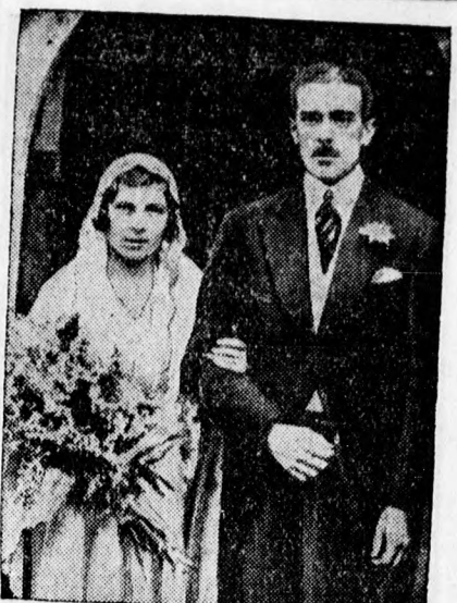
Lady May Cambridge, az angol ki- rály unokahuga egy polgári szármá- zású gárdakapitányhoz, Henry Abel Smithhez ment feleségül.