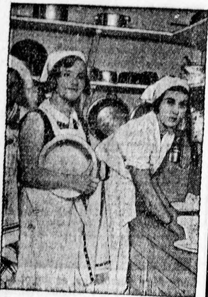
Ingrid hercegnő, a svéd trónörökös leánya egy stockholmi főziskolában tanul.