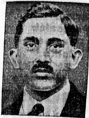
Sahabazada Navab Azam Jah, a világgazdag emberének, a haiderabadi nizamnak legidősebb fia eljegyezte Abdul Medzsid török exkalifa leányát.

ost szerezze be Őanyagját a ősi és Lőv kereskedő cégnél, mert bb a minősége és leg- csőbb az ára. l- fon: 945. ngária" malom mellett.