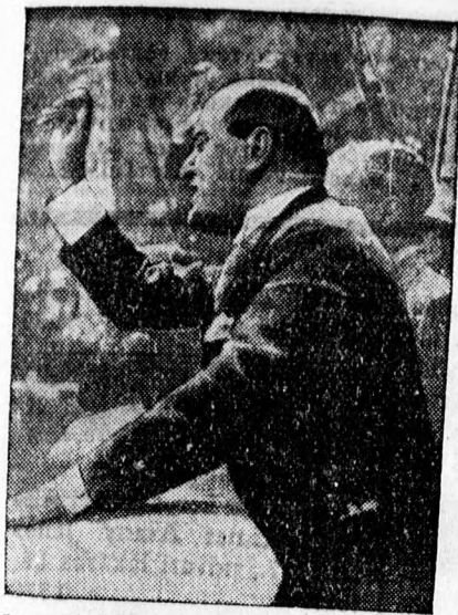
Mussolini Nápolyban a békereviziót követelő beszéde közben.

ben, ha a levél elvész a postán? A Bocskayt még ekkor sem lehetett volna felelősségre vonni, mert szabályszerűen járt el, amikor egyszerű levélben küldte el az elismervényt. Ez volt mindig a gyakorlat. Mig tehát a Bocskaynak semmit sem hittek el, addig az Újpest látszatbizonyítékát, ami minden tárgyi alap nélkül való, 100 százaléki elfogadták. Ez a magyar profifutball.