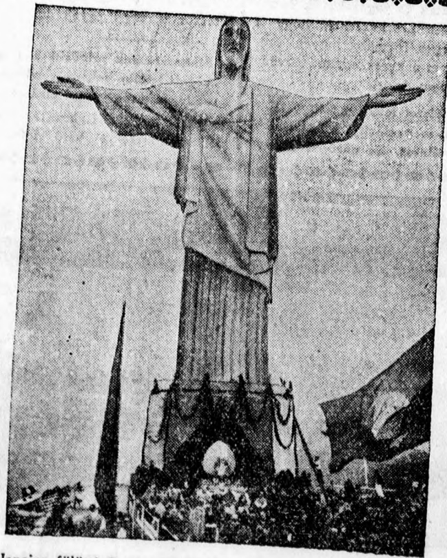
A Rio de Janeiro fölötti Corcovado-hegyen emelt óriási Jézus-szobrot most szentelték fel.