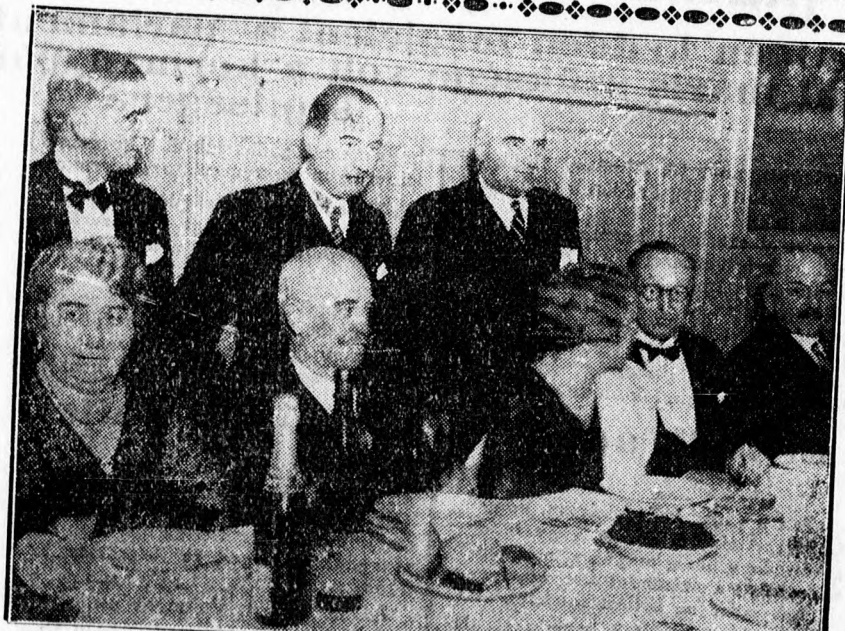
Az asztalfele a Kardos-cég centenáriuma alkalmából rendezett vacsorán.