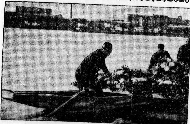
A dunai hajósok minden halottak napján koszorút sülyesztnek a Dunába vízbe vesztett társaik emlékére.

Eladó házhelyek a Sestakertben és a Hadházy ucca végén, illetve az Erdősoron 250-300 öles nagyságban. Értekezhetni Tóth és Sebestyén R. T. Fűrdő u. 2. sz. irodájukban. Telefon 6-10.