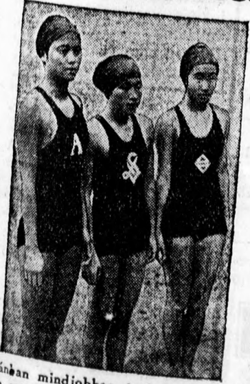
Japánban mindjobban terjednek a modern sportok. Három japán diáklány, akik egy iskolai uszónnepezen Tokióban rekordot állítottak fel.

A mérkőzés pontosan délután két órakor kezdődik, mert a korán bedtől este miatt a kezdetet tovább halasztani nem lehet. Bizonyos azonban az, hogy a tribün és a korzósülés közönsége, éppen úgy, mint az állóhely, igen jól teszi, ha helyének biztosítása céljából már félórával a mérkőzés kezdete előtt kimegy. Ezen így ajánlatos az óvatosság a tolongás elkerülése céljából a jegyelvétel tekintetében is. A Bocskay most is jelentős elővételi kedvezményt nyújt a meccsátogatóknak és ennek igénybevétele nem-