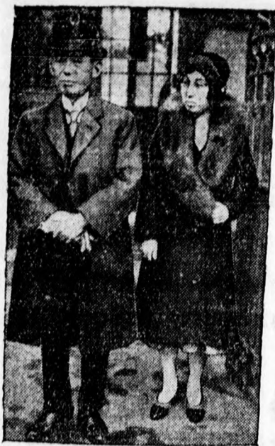
Yosihava, a párisi japán követ fontos tárgyalásokat folytatott Briand francia külügyminiszterrel a japán-kinai konfliktus ügyében.