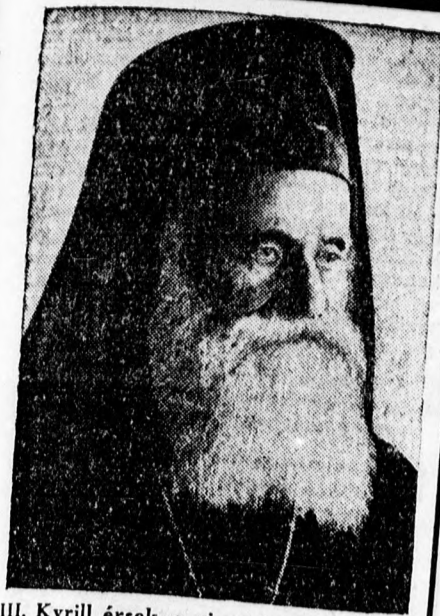
III. Kyrill érsek, a ciprusi görög-orthodox egyház patriárchája, a ciprusi nemzeti mozgalom egyik vezére.