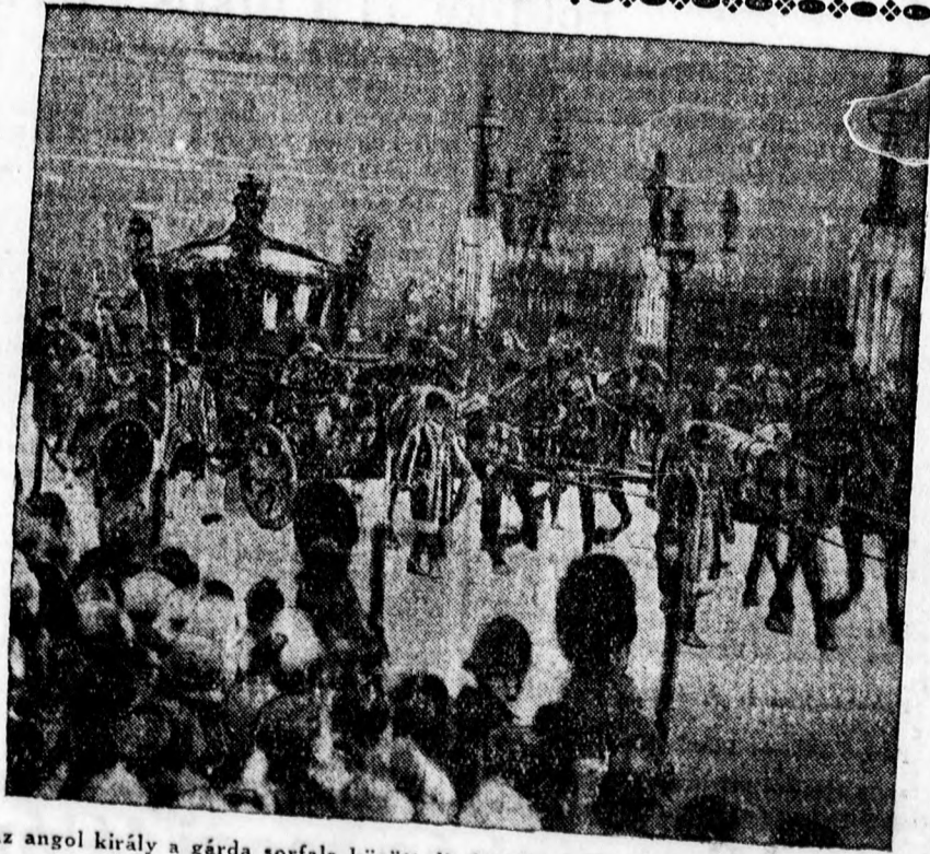
Az angol király a gárda sorfala között diszhintón a parlament megnyitására megy.

Szörmebundák kijavítását átalakítását o'csón válam a nyár folyamán kész bundák, prémbőrök nagyválasztékban KÖVÁRY szücs mester, József kir. herceg ucca 3. szám.