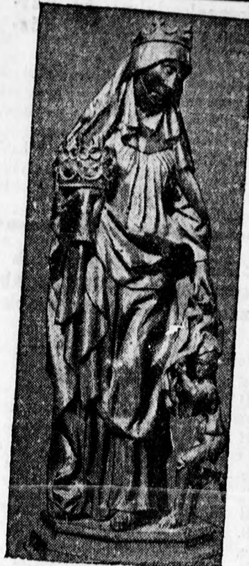
November 19-ikén hétszáz esztendeje, hogy Magyarországi Szent Erzsébet 24 éves korában meghalt. Gótikus Erzsébet-szobor a berlini Kaiser-Friedrich-Museumban.

mely részletesen felölelte az egyesület tavalyi működését. A titkári jelentés hangsúlyozta, hogy