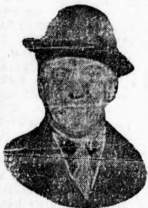
Bajcsy Zsilinszky Endre.

Szerdán este a Déli-muzeum előadótermében a Keresztény Nemzeti Liga Magyar válság—világvilág című előadássorozatában vitéz