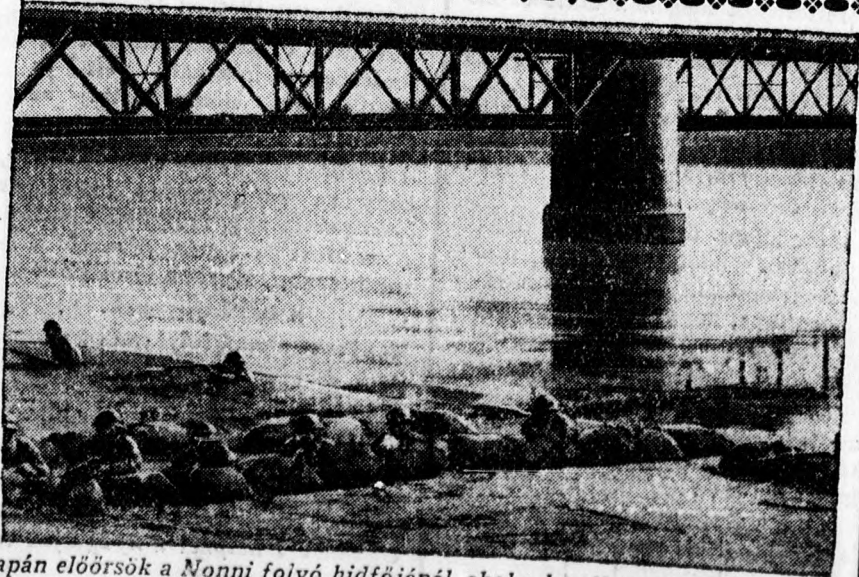
Japán előrsök a Nonni folyó hídjénél, ahol a legelkeseredettebb harcok folytak a japánok és kínaiak között.

Ezzel magyarázzák, hogy tegnap este a kormányválság hírei terjedtek el a fővárosban és nagy izgalmat váltottak ki. Ma délelőtti az izgalom még fokozódott