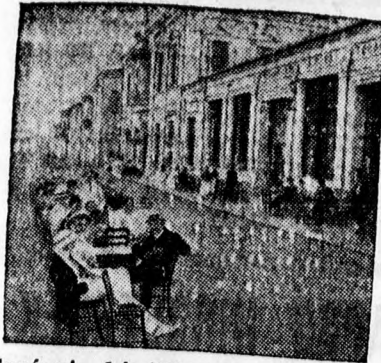
Európai kávéházuca a Ciprus-szigetbéli Larnacaban.

ányi And- léiben az- kerékpár- tes ello- lentésére