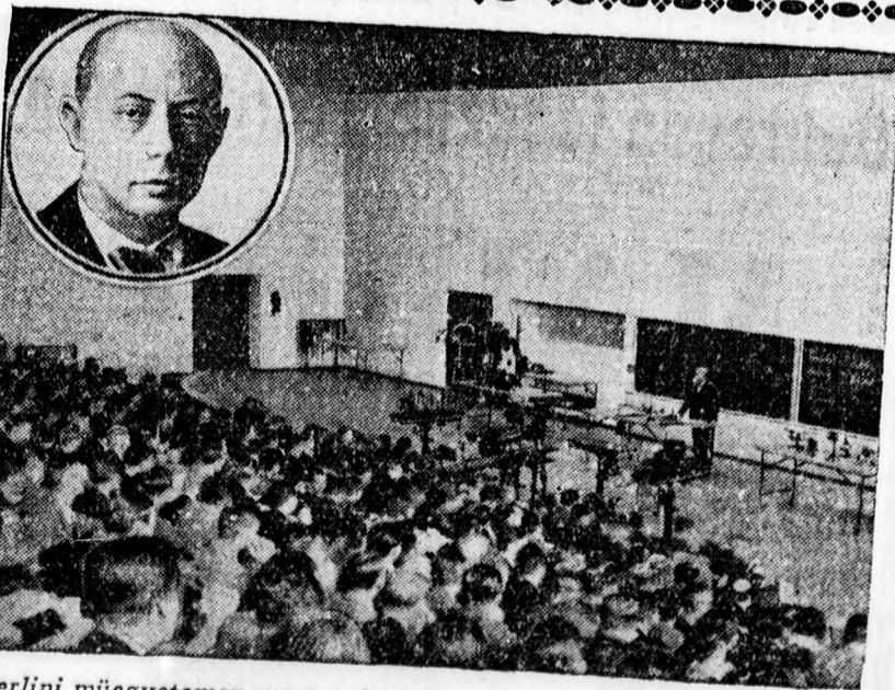
A berlini müegyetemen most nyitották meg az új nagyszabású fizikai kutatóintézetet. A kép az előadótermet ábrázolja, fenn a balsarokban a Nobel-díjas Gustav Hertz professzor, az intézet vezetője.

Hajdúvármegye megkereste Debrecen várost is, hogy eljárását hasonló felirattal támogassa. A jog- és pénzügyi bizottság most kimondta, hogy Hajdúvármegye akcióját nemcsak a legteljesebb mértékben helyesli, hanem kimondandónak tartja, hogy a belügyminisztérium találja meg a módját annak, hogy a közalkalmazásban állók mintegy erkölcsi kényszer alatt, a nem közalkalmazásban állók pedig hazafias kötelességből magyarosítsák meg nevüket.