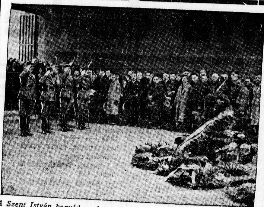
A Szent István honvéd gyalogezred tiszti küldöttsége Berlinben megkoszoruzza a birodalmi emlékművet.