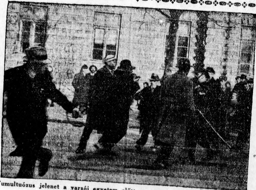
Tumultuózus jelenet a varsói egyetem előtt az antiszemita diákok zavargásánál.

Tüzifa és szén előnyösen beszereshető Lobstein Testvérek Ferenc József ut 16. II. em. Telefon 11-34. Telep: Pesti ucca 2, Telefon 13-95.