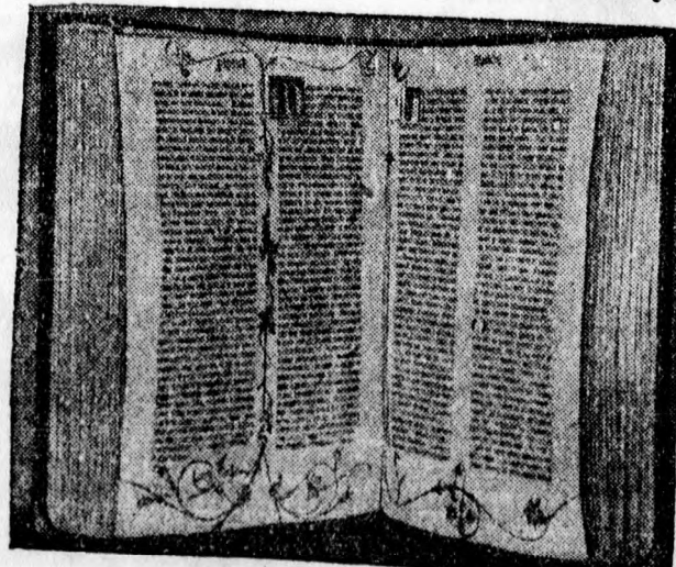
Londonban most árverezték el a különösen ritka Gutenberg-biblia egy példányát félmillió márkáért.