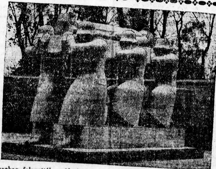
Würzburgban felavatták a Heuler szobrászművész alkotta monumentális hatású hősi emlékművet.

furfangos valutaüzérkedést követnek el. A főkapitányság intézkedésére ma délelőtt a négy detektívet őrizetbe vették, hogy ügyüket teljes mértékben