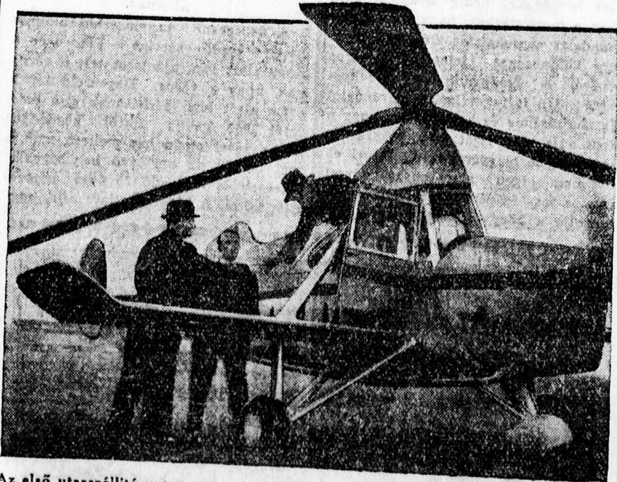
Az első utasszállító autogyro repülőgép, amelyet Angliában építettek meg és amelyet a jövő repülőgépeinek tartanak.

református egyház között igen sok kapcsolat van, igen sok, a debreceni egyetemen végzett lelkész van ennek az egyháznak papjai sorában s dolgozik nagy lelkesedéssel, profétai elhivatottsággal és önzetlenséggel az egyház célján, hogy magyar reformátusoknak tartsa meg a kivándorolt magyarokat,