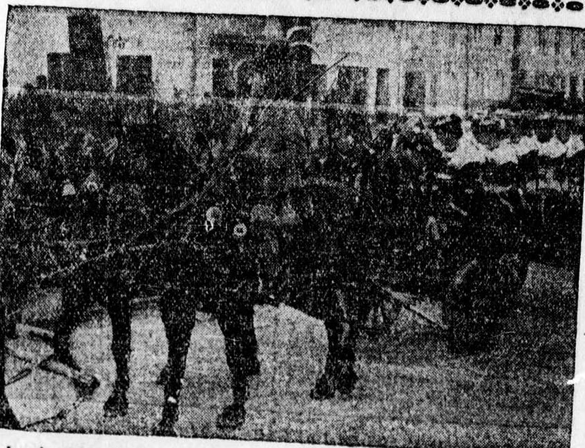
A lovak védőszentjének ünnepe Bajorországban. Bajorországban minden évben novemberben nagy ünnepségeket tartanak Tölz fürdőn, ahova a környék gazdái feldisztított kocsikon jönnek be, hogy megáldassák lovaikat.