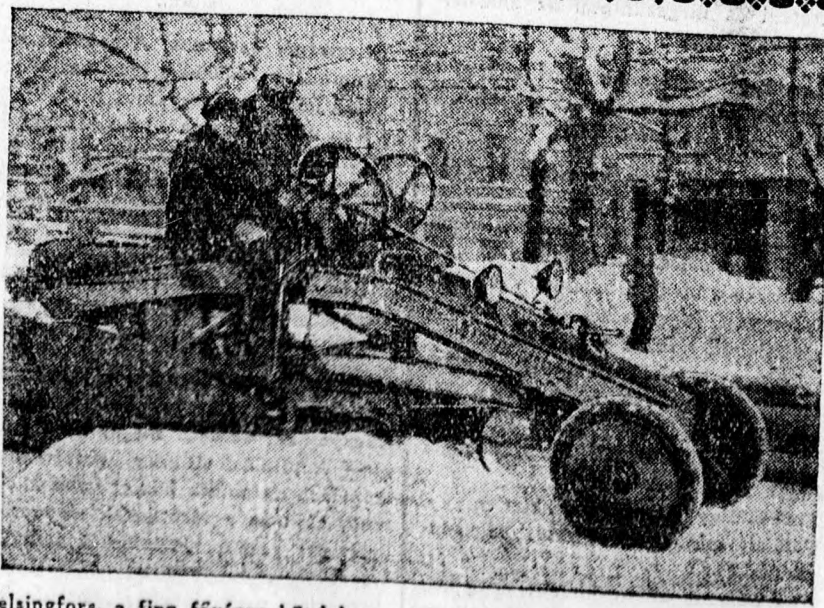
Helsingfors, a finn főváros küzdelme a hó ellen. A finn fővárosban a legmodernebb hóelével takarítják az utat a hallatlan tömegű hótól.

A közönség saját érdekében cselekszik, ha az átkapcsolás alatt a telefont nem használja, mert ezzel a zavartalan átmenetet elősegíti. Az auto-