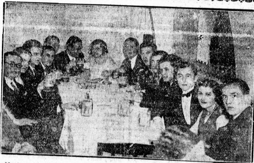
Vasárnap kitünően sikerült a Dóczy-intézet Lilla-teastje az Arany Bikában. A teast résztvevőinek egy csoportja.