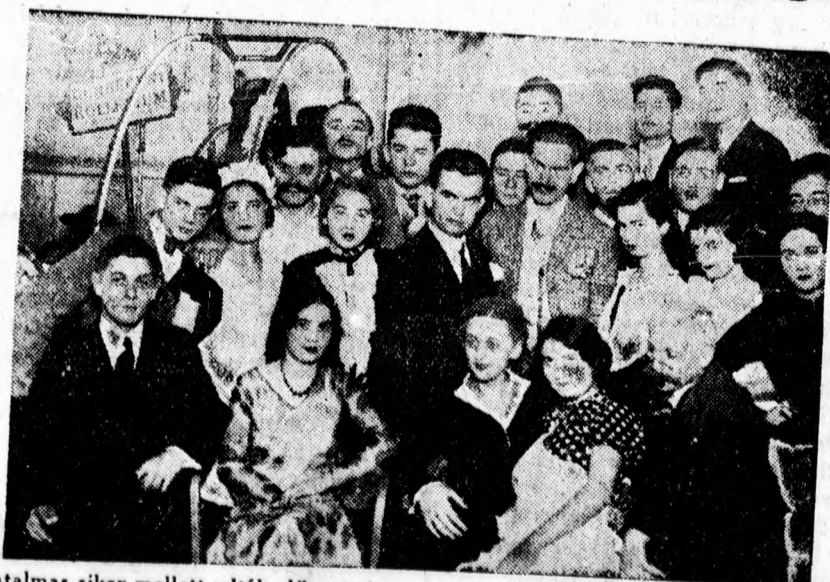
Hatalmas siker mellett adták elő szombaton a ref. gimnázium és a Dóczy növendékei Csathó Kálmán „Te csak pipáld Ladányi” című vígjátékát.

Az alábbiakban öt közalkalmazott felesége nyilatkozik, a kegyelmes asszonytól a máv. munkás fe-