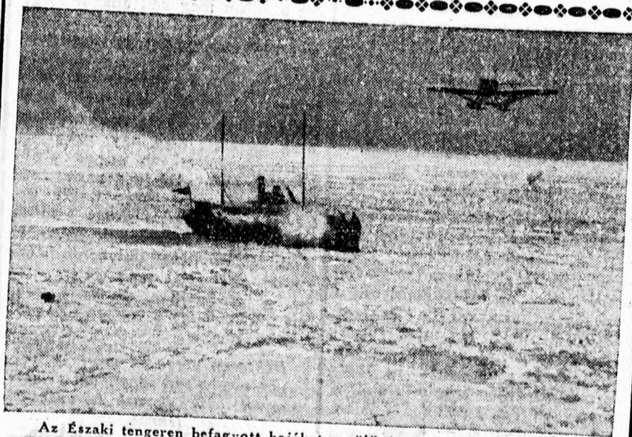
Az Északi tengeren befagyott hajókat repülőgépről látják el élelemmel.

Poloskát és svábot gyökeresen irt Takarítási Vállalat