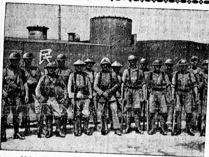
A nemzetközi rendőrség egy őrsége Tiencsin koncessziós városrésze előtt a japán-kínai konfliktus idején.