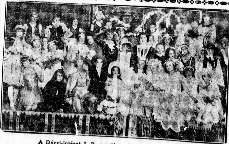
A Dóczi-intézet I. B. osztálya „János vitéz” szereplői.