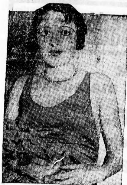
Páris új szépségkirálynője egy divat- áruház alkalmazottja.

Ujságot vásárolni és... 287 számu szelvény