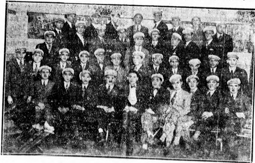
A zsidó dalkör, mely a mult vasárnapi dalos-esten fényes sikerrel szerepelt, szombaton este önálló hangversenyt ad a Zenedében.