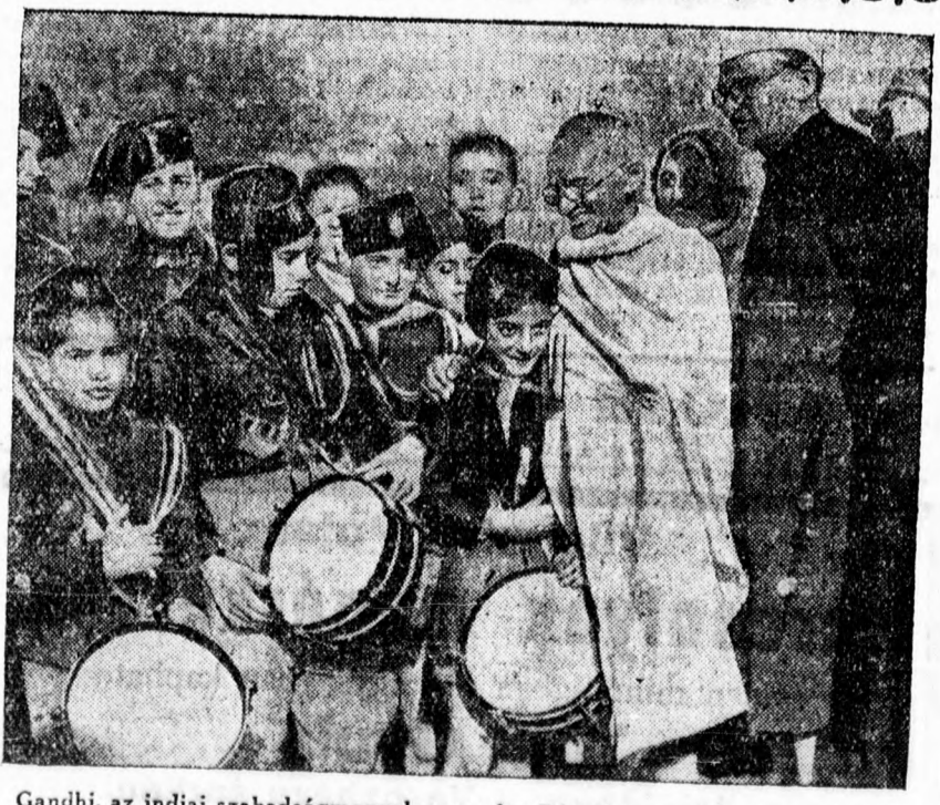
Gandhi, az indiai szabadságmozgalom vezére Rómában szemlélet tart az ifjuságiszták „Balilla” organizációja felett.

ezután felforgatta és kifosztotta az üzletet. A nyomozás eddig nem tudta megállapítani a gyilkos személyét és azt sem, hogy a tettes mennyi pénzt vitt el. Annyit azonban már kiderítettek, hogy az öregasszony felmondta az egész, kaposvári bankoknál levő, 13