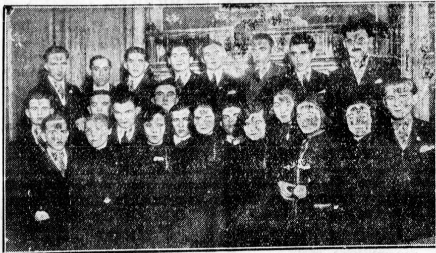
A Munkás-Otthon szavalókórusa nagy sikerrel szerepelt az Iparoskörben.

Mutassa meg rosszfogát, műfogát Váry fogműtermébe, Rothermere u. 3. szám.