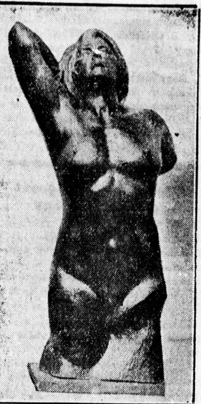
A lord Rothermere által Debrecennek ajándékozott szobor.

„PARACELSUS SÖR“-e Magyar ipar főzte „ANGOL“-ban csapolják Mindig többen isszák.