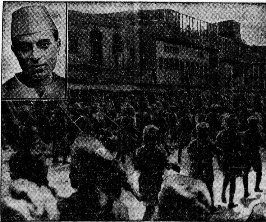
Indus csapatok bevonulnak Peschawarba, az északnyugatindiai lázongások főszínhelyébe. Fenn balra: Pandit Jawaharlal Nehru, a pánindiai kongresszus elnöke, akit az angol hatóságok fogságba vetettek.

Ha olcsón, divatosan akar ruházkodni, forduljon bizalommal Keresztesi úri-szabóhoz, Varga u. 1.