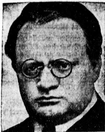
Arnaldo Mussolini, a Duce most elhunyt öccse.