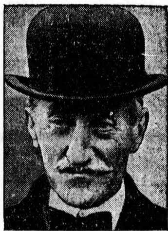
Lord Willingdon, indiai alkirály.

Bombayban tegnap hatalmas népgyűlés volt, amelyen legalább 50.000 ember gyűlt össze. — A letartóztatott Vallabhai Patel testvére szózatot intézett a néphez, hogy bojkottálja az angol árukat, de különben is tartózkod-