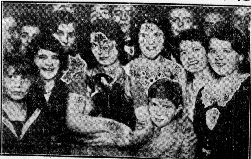
A Csapókerti Független Olvasókör műsoros teastélyén megjelent közönségnek egy jókedvű csoportja.

Közli az évkönyv, hogy a törvényhatósági jogú városok előirányzott háztartási szükséglete 1929-ben 275 millió pengőre rugott, ezzel szemben 1930-ban csak 251 millió pengő volt. A megyei városok szükségletelőirányzata 1930-ban 55 millió pengőt tett ki.