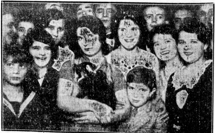
A Csapókerti Független Olvasókör műsoros teastélyén megjelent közönségnek egy jókedvű csoportja.

Közli az évkönyv, hogy a törvényhatósági jogú városok előirányzott háztartási szükséglete 1929-ben 275 millió pengőre rugott, ezzel szemben 1930-ban csak 251 millió pengő volt. A megyei városok szükségletelőirányzata 1930-ban 55 millió pengőt tett ki.