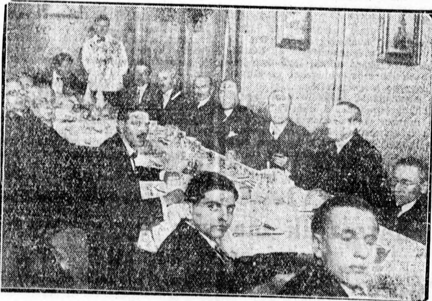
A Sakk-Kör vacsorája az Ujságíró Clubban.

És bár a mai nagyon nehéz gazdasági viszonyok közt az anya-és csecsemővédelem sem lehet olyan eredményes, mint amilyennek szeretné, mert hiszen az áldott állapotban levő anyák hiányos táplálkozása és erős testi munkája nagy hatással van a magzat fejlődésére és az egyre több koraszületés és ennek következtében megállapított