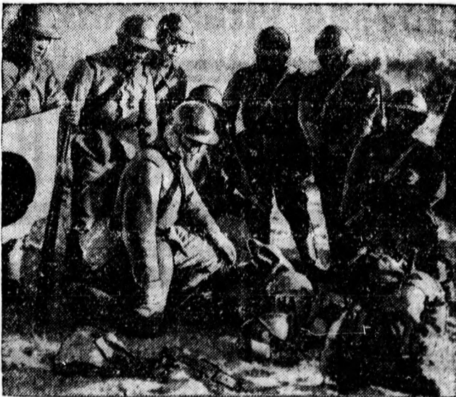
Japán katonák eltemetnek egy Mandsuriában elesett tisztet.