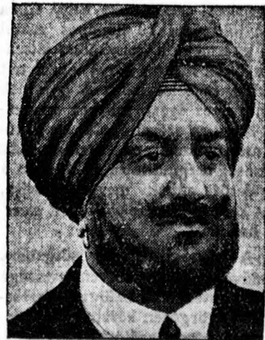
A patialai maharadza. Patiala pandzsabi tartomány, amelynek másfélmillió lakosa van, keményen tiltakozott a Gandhi és követői által ki-mondott passzív ellenállás ellen.

A december havi behozatal értéke az előző évi decemberi behozatal értékéhez viszonyítva 26.1 millió pengővel alacsonyabb. A december havi kivitel értéke az előző évi decemberi kivitel értékével szemben 28.5 millió pengővel kisebbedett.