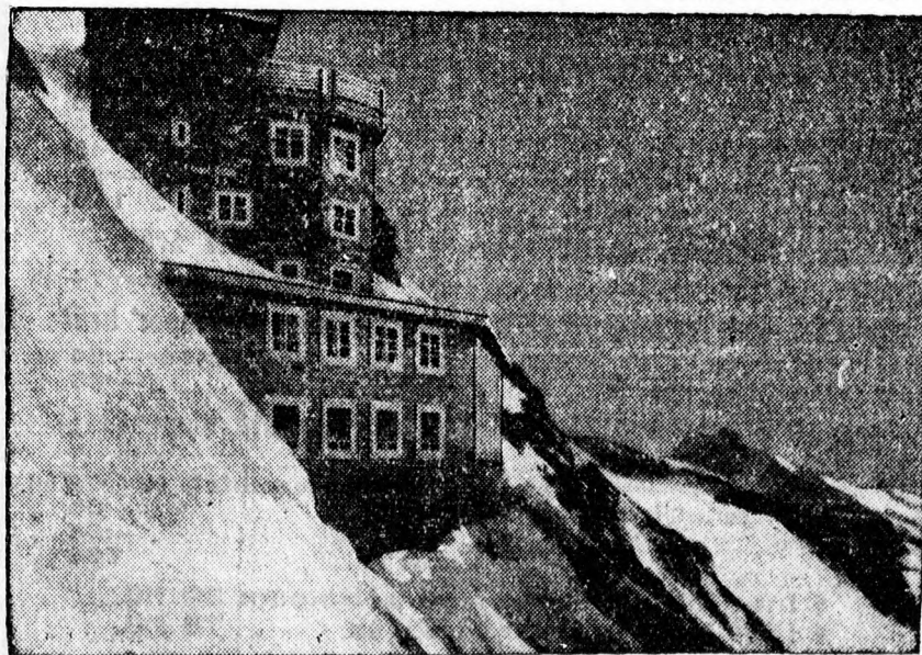
A Jungfraun 3457 méter magasságban tudományos kutató intézetet állítottak fel.

Itt említjük meg, hogy egy későbbi időpontban Barcza Gedeon vakszimultán előadást is tart, amikor öt ellenféllel játszik egyszerre tábla nélkül. Ez a produkció szintén nagy sikerre számíthat.