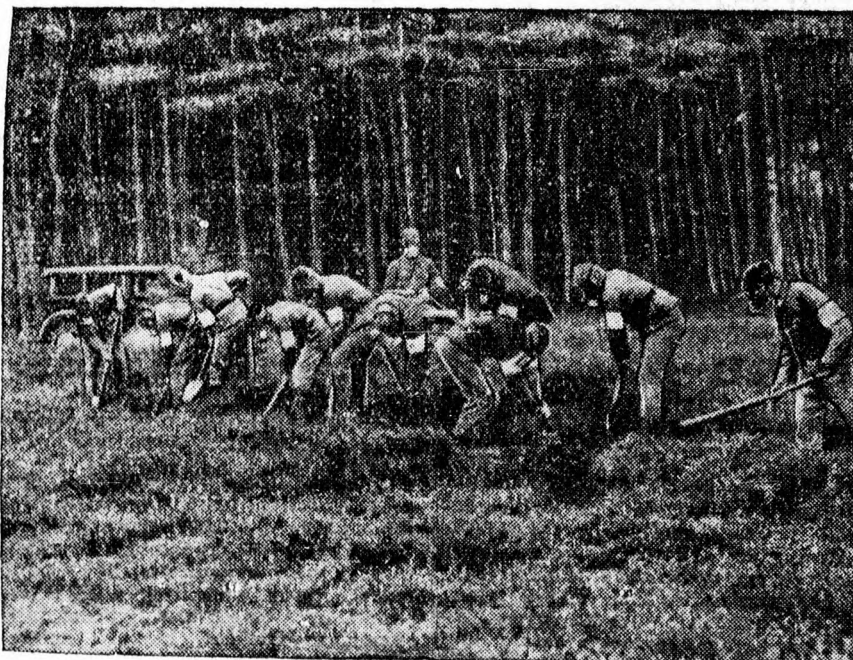
Műszaki segédcsoportok munkában egy Lübeck melletti óriási erdőégsnél.