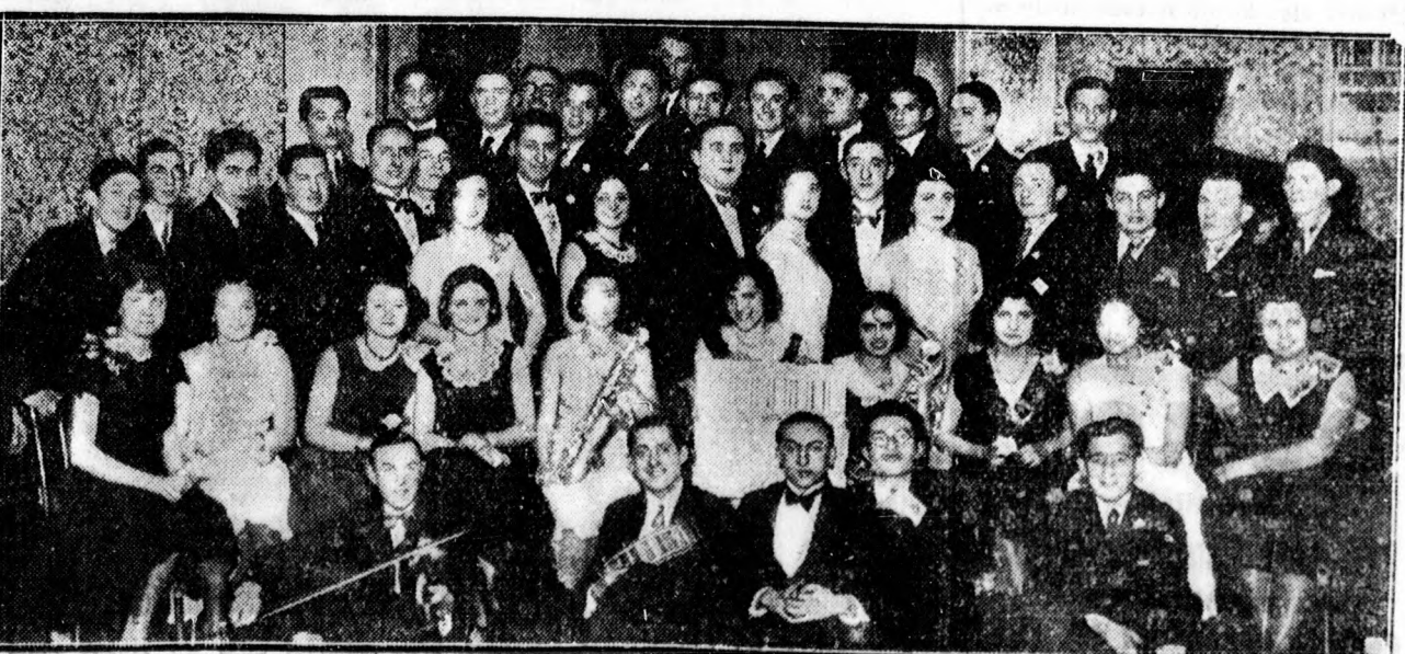
Az Izraelita Ifjak Dalköre nagyszerű táncestélyt rendezett.