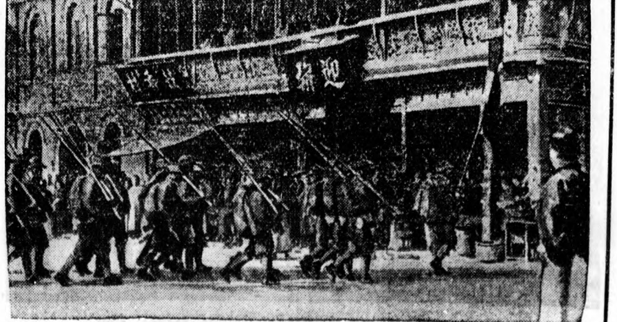
Kínai kormánycsapatok Nankingből állásba vonulnak.

A kiscgazdák továbbra is elégedetlenek voltak, sőt az utóbbi napokban a kormánypártban aláíráásokat gyűjtöttek Ivády ellen.