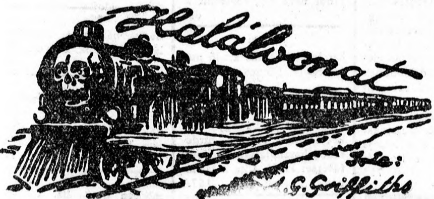
Vecsey Leó fordítása.

Perzsaszőnyegek, festmények, vázák, csillárok, uriszoba butor eladó. Batthyány u. 9., uccai lakás. 758 Ügynököket jutalékkal felveszünk. — Aslartis-iroda, Piac ucca 72., I. emelet. 757 Kelengyevásznak csoda olcsón kaphatók, míg a készlet tart. — Batthyány 16., udvarban. 1159