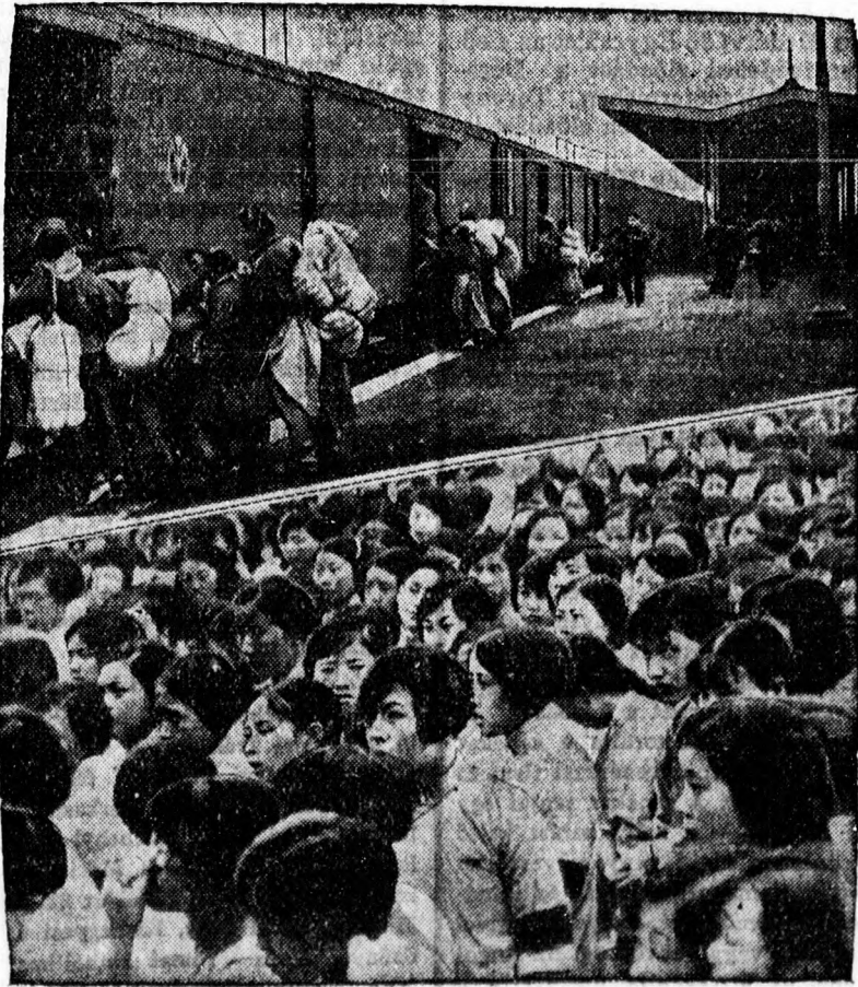
Fenn: A kínai lakosság tehervonatokon menekül a japánok elől a veszélyeztetett zónából. Lenn: Fiatal kínai nők tüntetnek a japánok ellen.