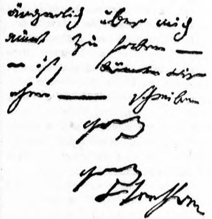
Beethoven kézírása. A névalírás B-jében a felső ív lépcsőzetes alakítása jellemző a harmóniák fejedelmére.

Klages mutatott rá arra az egész lelki életet új világításba helyező tényre, hogy lelkünk tudatalatti világában hatalmas küzdelmek folynak le indítások és gátlások között. Gondolataink, tetteink, magatartásunk ilyen küzdelmek eredménye, melyek — sajnos — titokzatos homályban maradnak és csupán áldásos vagy végzetes döntéseik jutnak fel öntudatunkba és formálják életünket. A psychoanalízisben és a grafológikus elemzésben azonban olyan eszközök kerülnek kezünkbe, melyekből, hacsak villanásszerűen is, fény vetődik ezeknek a tudatalatti küzdelmeknek izgatón és végzetesen érdekes világára. (6. ábra.)