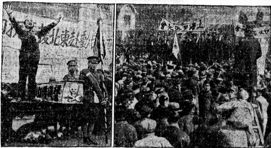
Kínai toborzás a Japán elleni védelmi harcra. (Baloldali kép.) Sanghai ifjúságának gyűlése a szabad ég alatt, a toborzás eredményének fokozása érdekében. (Jobboldali kép.)

A falu felét vissza is foglalták a kí- naiak. Vuszung erődítményei még min- dig a kínaiak birtokában vannak, bár már hetek óta bombázzák a japánok. Hir szerint mindkét fél veszteségei igen súlyosak és a japán tábornok két hadosztálynyi segítséget kért Tokióból. Hétfőn délben a japánok