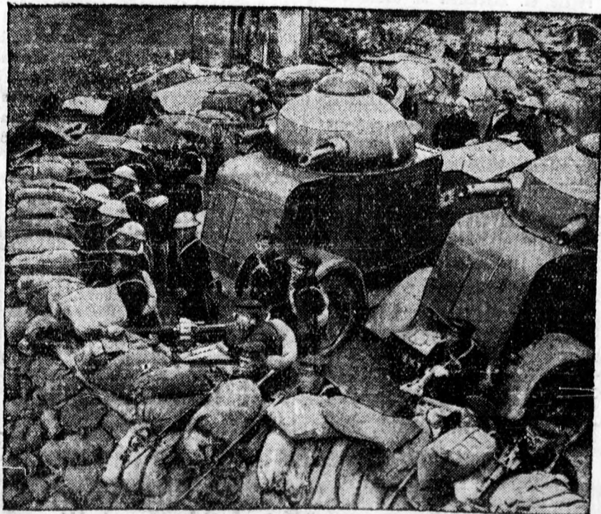
Sanghai uccái erődökhez hasonlítanak. Az északi pályaudvar körüli negyed egyik uccáján homokzsákbarrikádok megett helyezkedik el a japán tengerészgyalogság, melyet két páncélos támogat.

Előfeltétele ennek azonban az, hogy a japán csapatok kiszorítsák a kínai haderőket Shanghai területéről. Félhivatalos körökben azt hiszik, hogy a nagyhatalmak, mihelyt Japán dön-