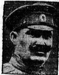
Semjonov, a szovjetellenes fehér-orosz emigráns vezére, tárgyalásokat folytat Japánnal, hogy Mandzsuriában fehér-orosz hadsereget szervezzenek.

A többi kormány csak azt kérte, hogy a japán páncélos hajók távozzanak.