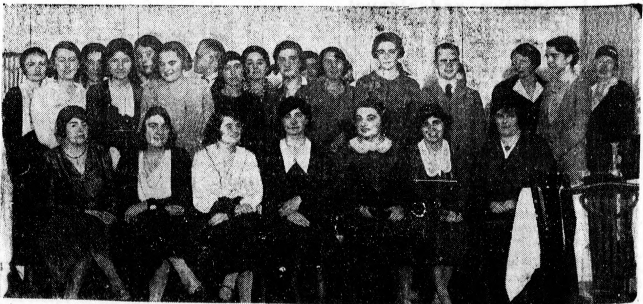
A Francia Kör első összejövetelének résztvevői az Angol Királynőben.

Az a tőkés, akinek jelenleg van részvénye a Nemzeti Banktól.