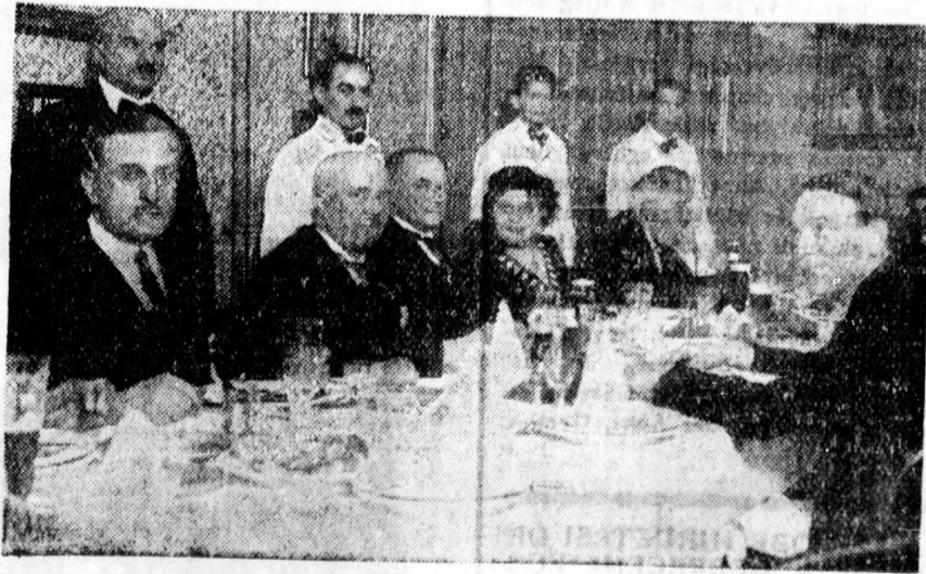
A Szacharov orosz tábornok (balról a harmadik) tiszteletére rendezett bankett az Ujságíró Clubban.

A jelentkezésnél a személyazonosságot a régi élelmiszerkönyv és lakásbejelentő lap felmutatásával kell igazolni; aki november óta lakást változtatta