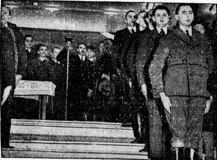
Adolf Hitler, az osztrák mázolósegédből lett német elnökjelölt beszél a sportpalotában egy gyűlésen. Beszédét különleges rádió-átvétellel közvetítették egy Berlin másik részén összehívott gyűlésen is.

A LEGJOBB HIRDETÉSI ORGANUM A DEBRECENI FÜGGETLEN UJSÁG.