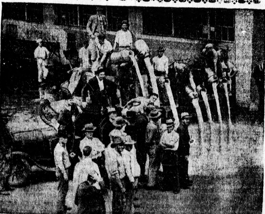
7000 liter tejet semmisítették meg a Dél-texasi Tejtröszt vezetői. A kiöntés azoknak a háza előtt történt, akiket az ársüllyedés okozóinak tartottak.