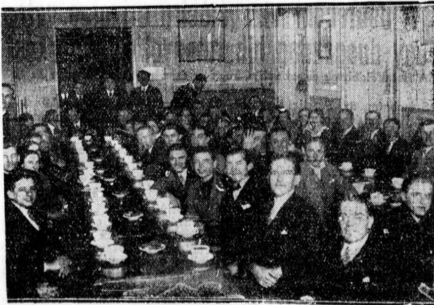
KIE nagyszerű teadélutánja közönségének egy része.

Debrecen talajának nagyobb része egyéb anyagokon kívül salétromot is tartalmaz. Debrecen a salétromtermelesnek egyik legnagyobb központja volt Magyarországon. Annak idején még a lakószobák földjét is felásták salétromért a buzgó termelők. Salétrom igen sok van a talajban még ma is Debrecenben. A salétrom a nem helyesen szigetelt házaknál felszivódik a falba és azt nedvéssé teszi, bizonyos idő múlva pedig kikristályosodik a falon és lerugja a festést. A városi hatóság most térképezni akarja a salét-