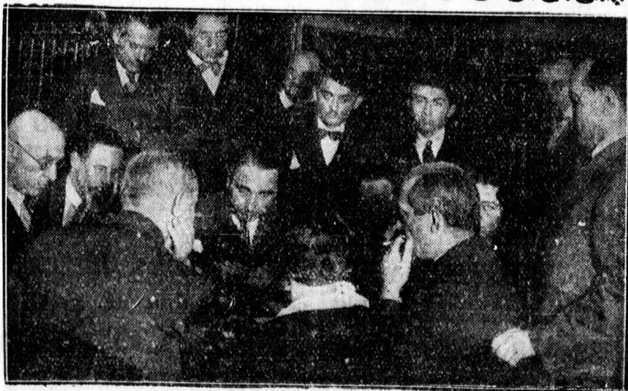
Az Ujságíró Clubban most folyó bridgeverseny egyik csoportja s az érdeklődők.