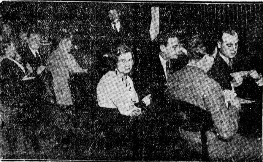
Az Ujságíró Clubban folyó bridge-verseny egyik csoportja.

erősen, hanem a nagyszámú gíbecsek csoportja is s mindenki az ő favoritjáért szorított. A verseny első része, a selejtező, tegnap este fél tíz órakor