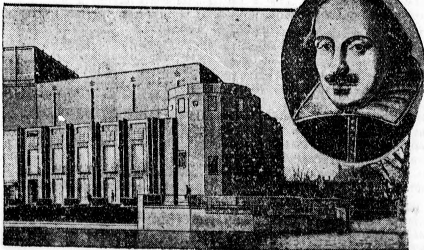
A stratfordi Shakespeare-színház most készült el Stratford on Avou-ban, Shakespeare szülővárosában. A színházat a költő születés napján, április 23-án, nyitják meg. Az ünnepségen megjelenik a walesi herceg is.