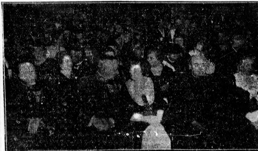
A MANSz szombati kultürestjének közönsége az Arany Bikában.