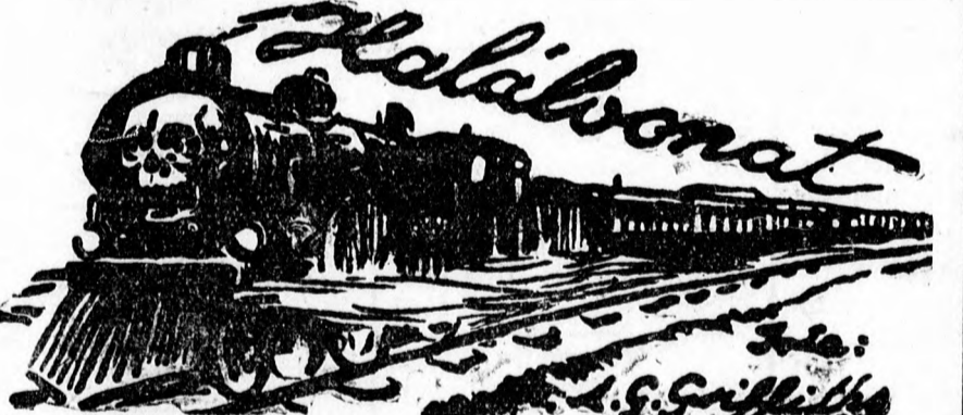
(22) Vecsey Leó fordítása.

Eladó hét holdas tanyásbirtok város alatt. Cim a kiadóban. 1660